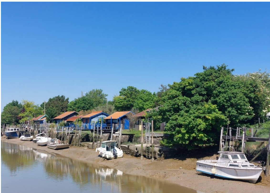
Le chenal d'accès au port de la Tremblade.