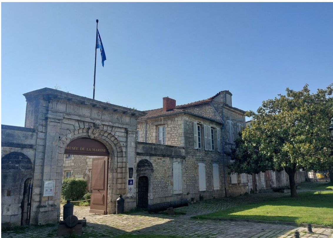
Le musée nationale de la Marine.