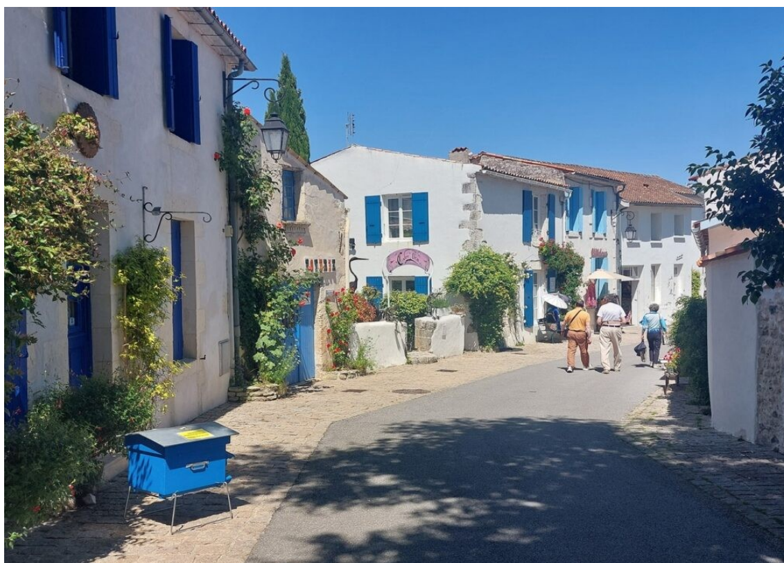
Mornac sur Seudre.