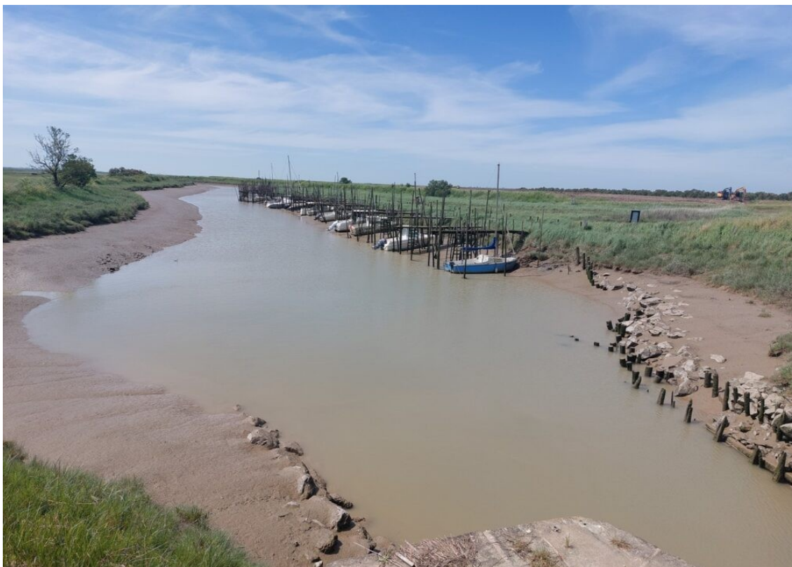
Le port de l'Épine à Puyravault.