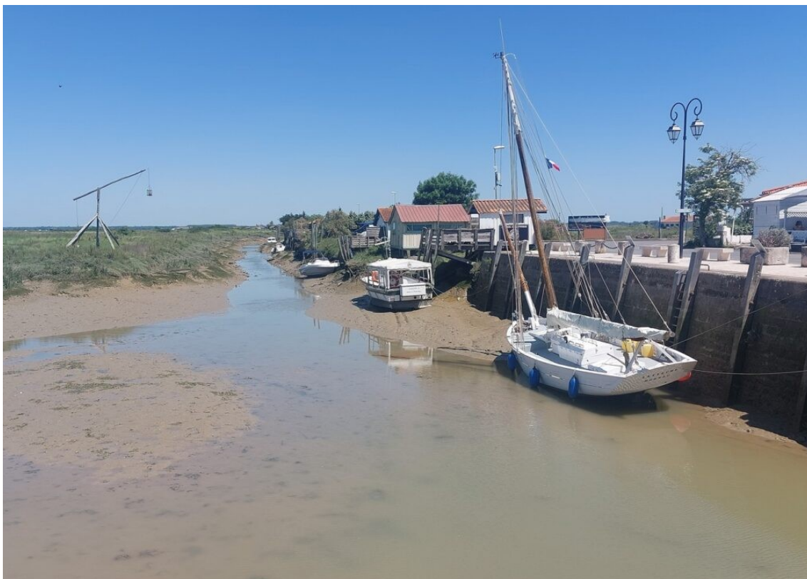
Le chenal de Mornac qui permet de relier le petit port de Mornac à la Seudre.