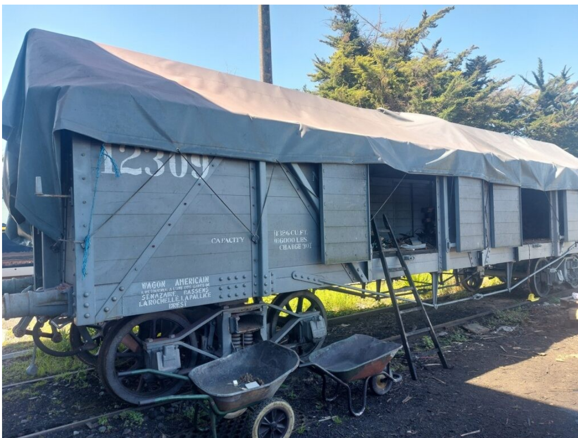
Wagon américain datant de la guerre 1914-1918. 38 000 wagons en kit ont été importés en Europe. Ces wagons ont contribué à la desserte du front, la reconstruction de l'Europe et ont ensuite eu une longue carrière sur le réseau Français (les derniers ont arrêté de circuler dans les années 1980).