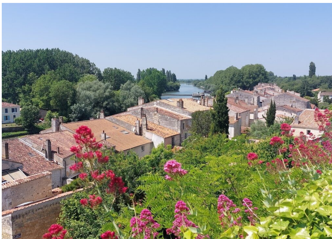
La Charente à Saint Savinien.