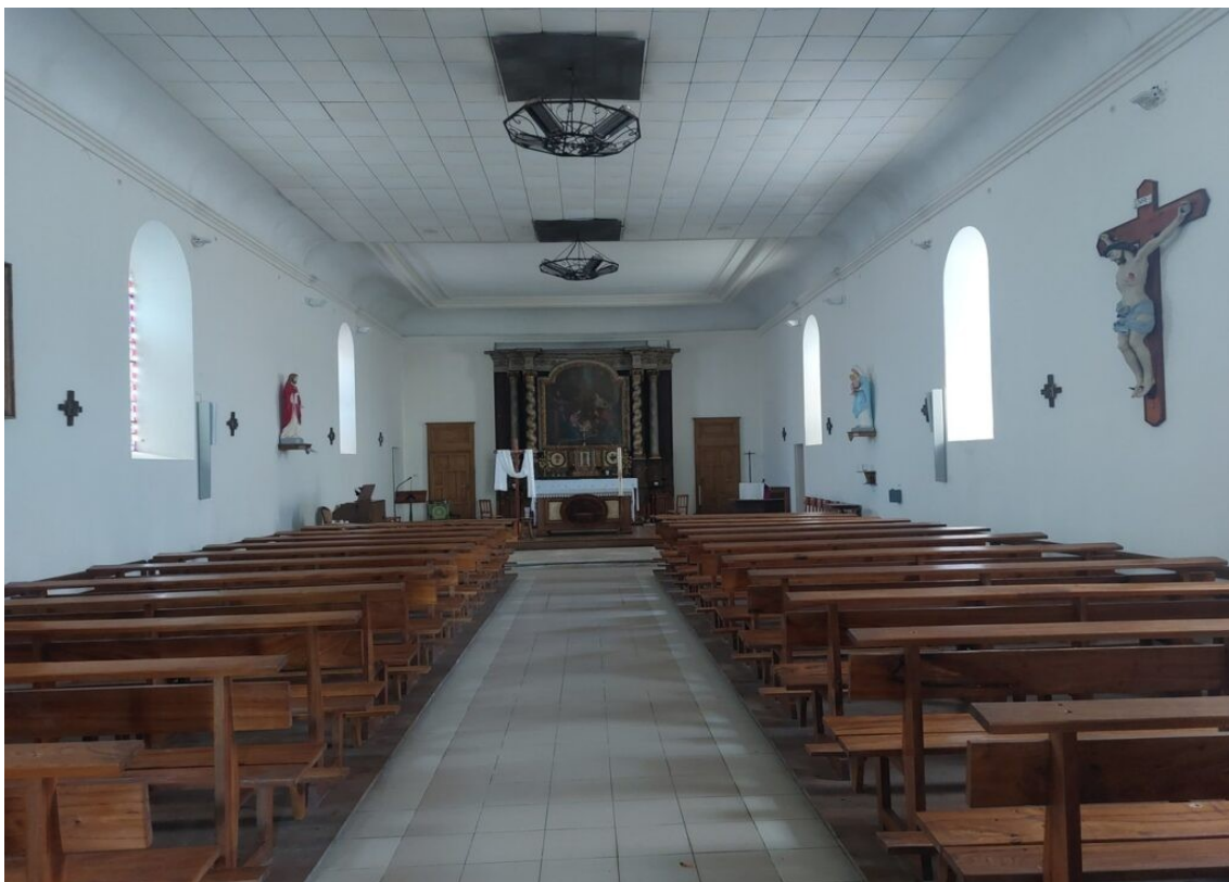
L'église de Charron.