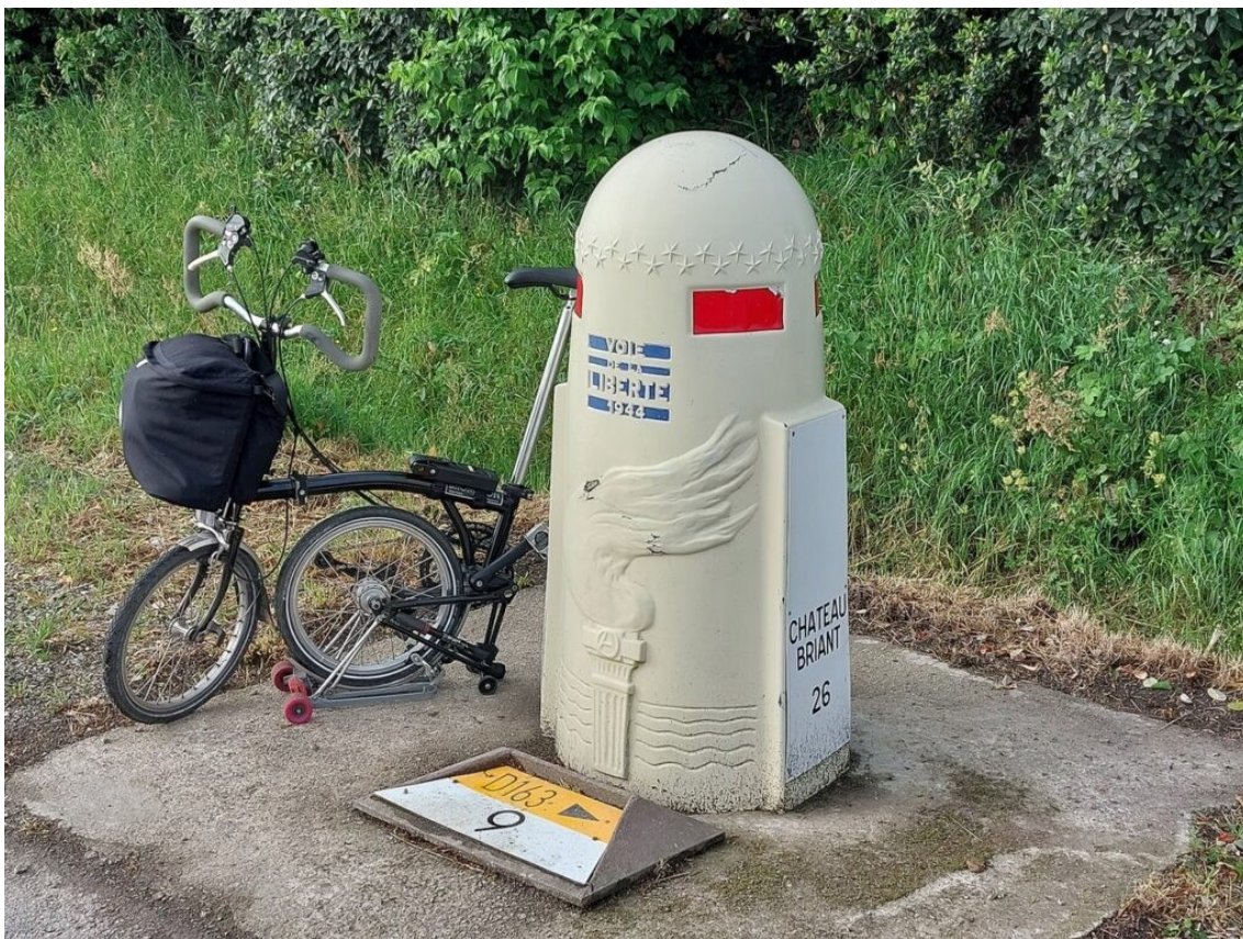
La mobilité en Brompton, sur la Voie de la Liberté de 1944. Impossible de trouver l'itinéraire de cette voie de la Liberté qui symbolise habituellement le trajet de l'armée du général Patton des côtes normandes vers le nord et l'est de la France. Une branche avait du descendre vers Châteaubriant qui fut libérée le 4 août 1944.