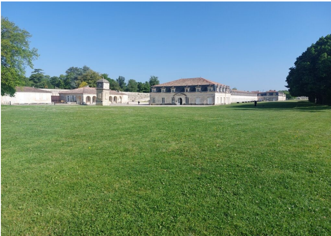
La Cordierie Royale de Rochefort.