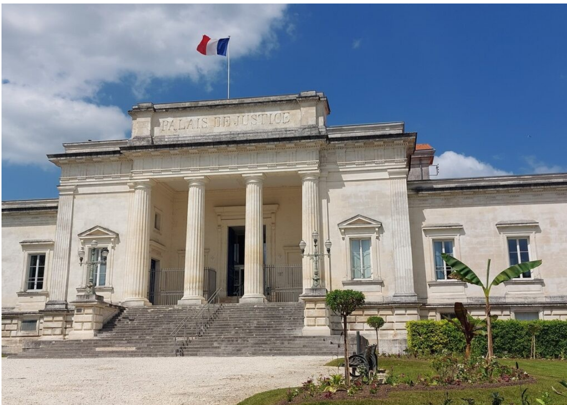
Le Palais de Justice de Saintes.