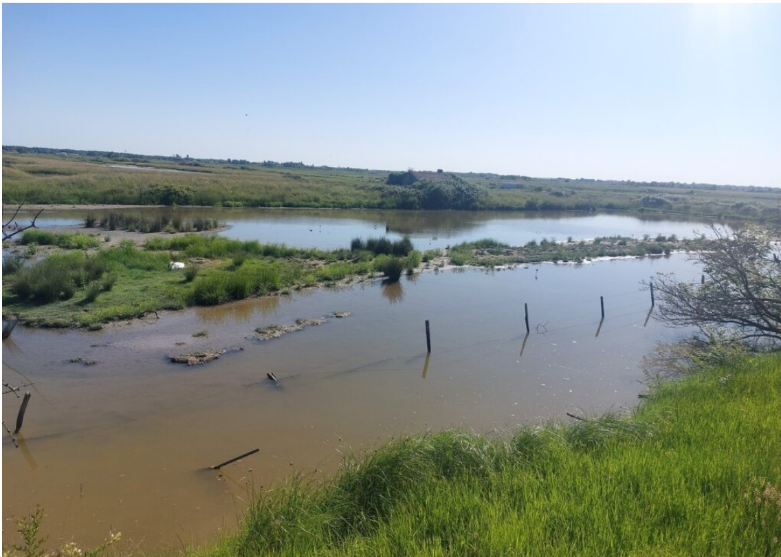
Le marais de la Seudre.