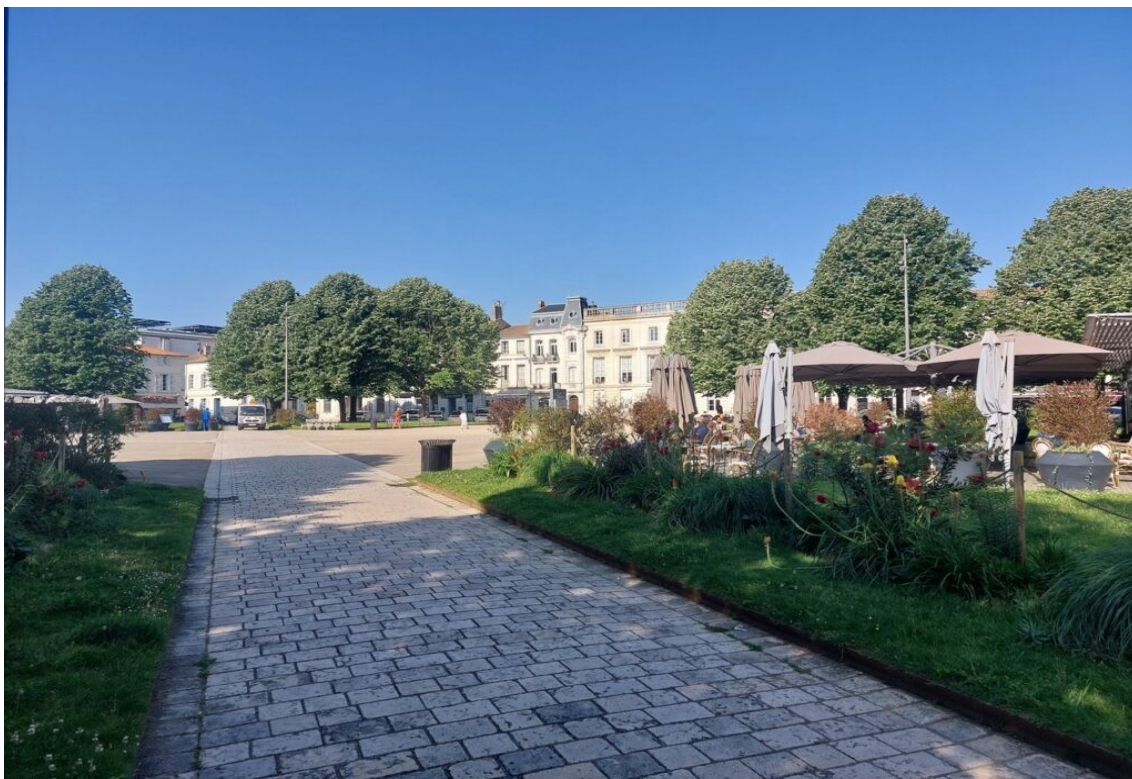
Place Colbert à Rochefort.