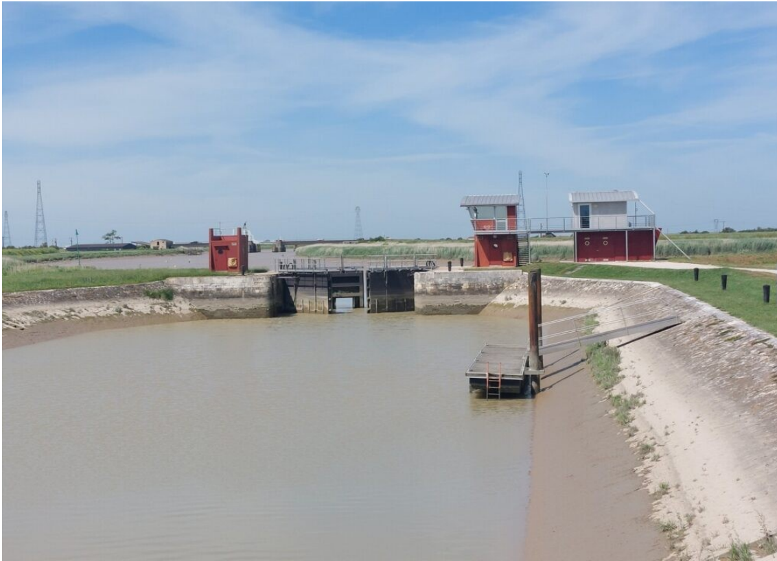
Écluse du Brault permet de relier le canal de Marans à la mer. Au fond, on aperçoit le pont tournant qui permet aux bateaux de rejoindre la mer. En tournant le pont coupe la circulation sur la route départementale.