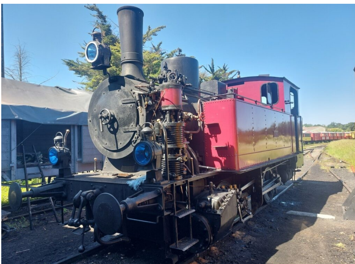
La locomotive HENSCHEL 030T, mise en service en 1912, fin d'activité en 1966, arrivée à Chaillevette en 2010, remise en service en 2015