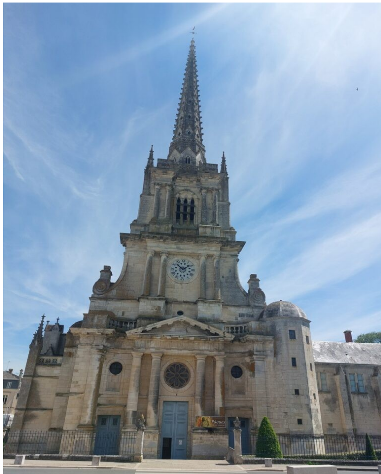
La cathédrale de Luçon.