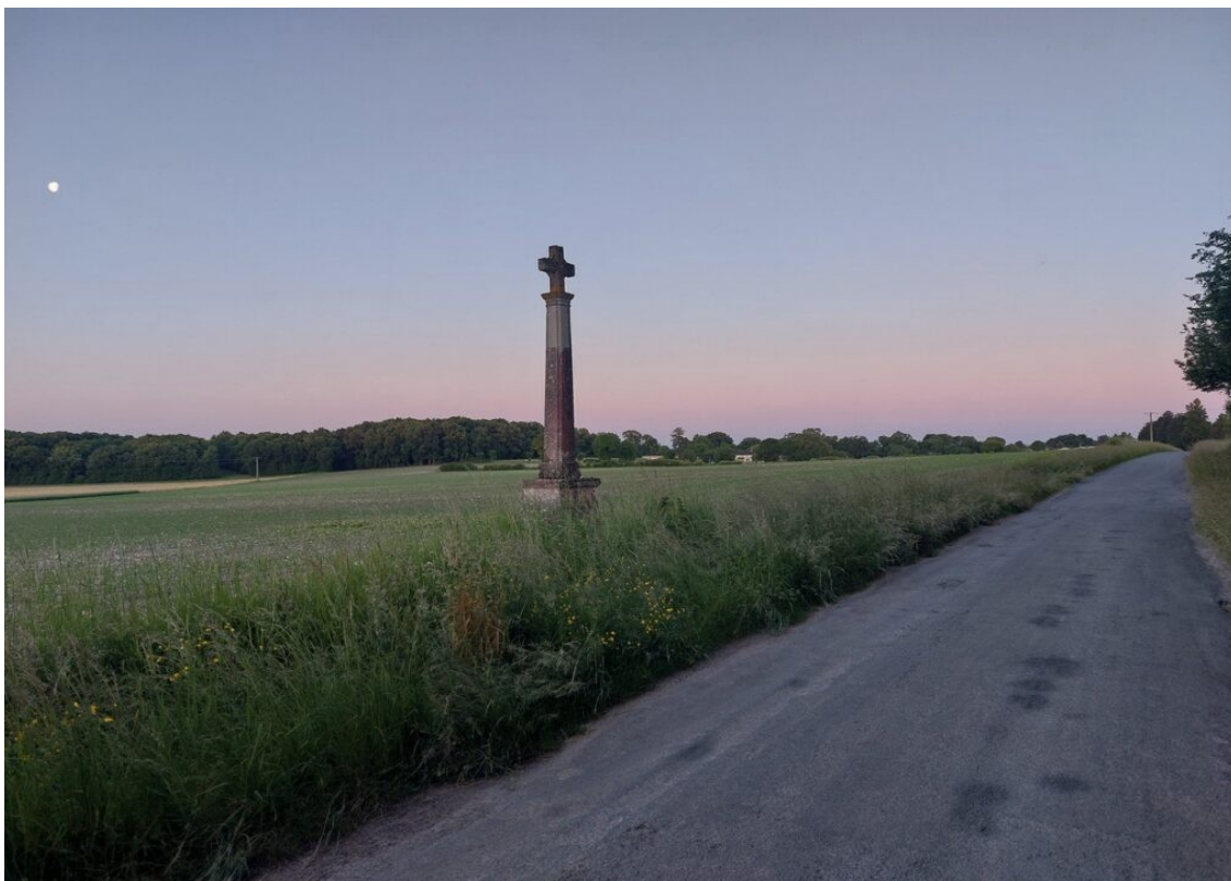
En quittant Saintes au soleil levant.