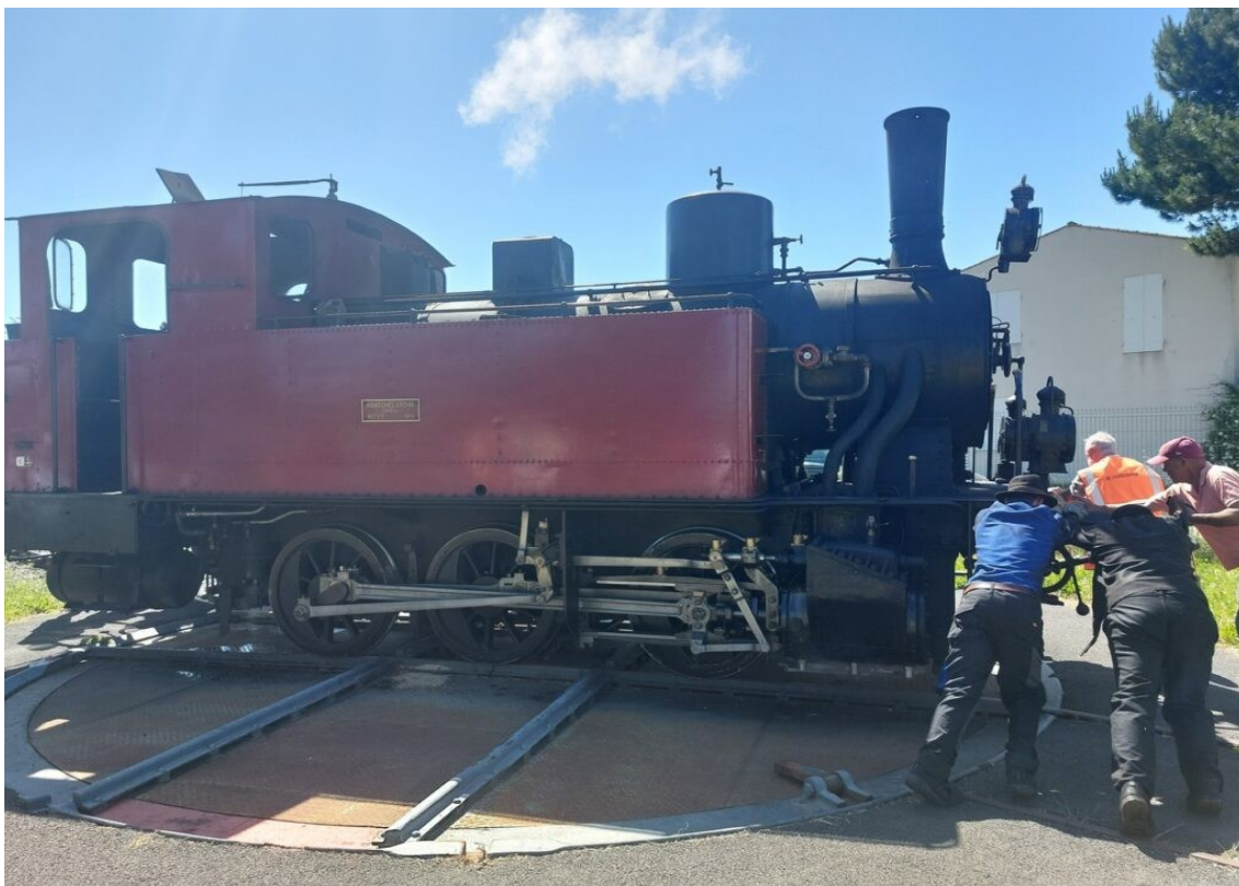
La locomotive est poussée à la main pour lui faire faire son demi-tour.