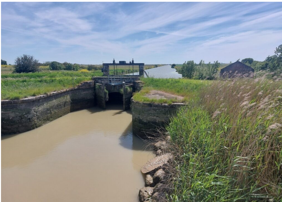
Vieille porte à flots du marais de Charron-Marans

Il est rare de voir un panneau directionnel fléché un département. Dans ce coin de Saintonge très marécageux, la Vendée est très proche, mais les franchissements de la Sèvre Niortaise, limite entre la région des Pays de la Loire et celle de Nouvelle Aquitaine, sont rares.