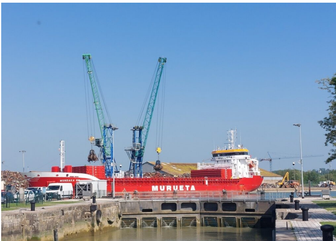
Chargement d'un cargo avec de la ferraille.