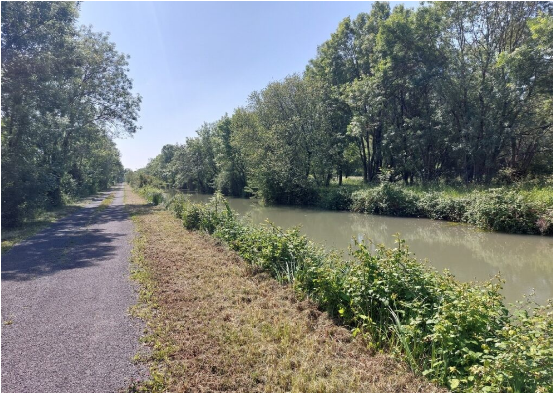
Le long du canal de Freussin, parallèle à La Charente.