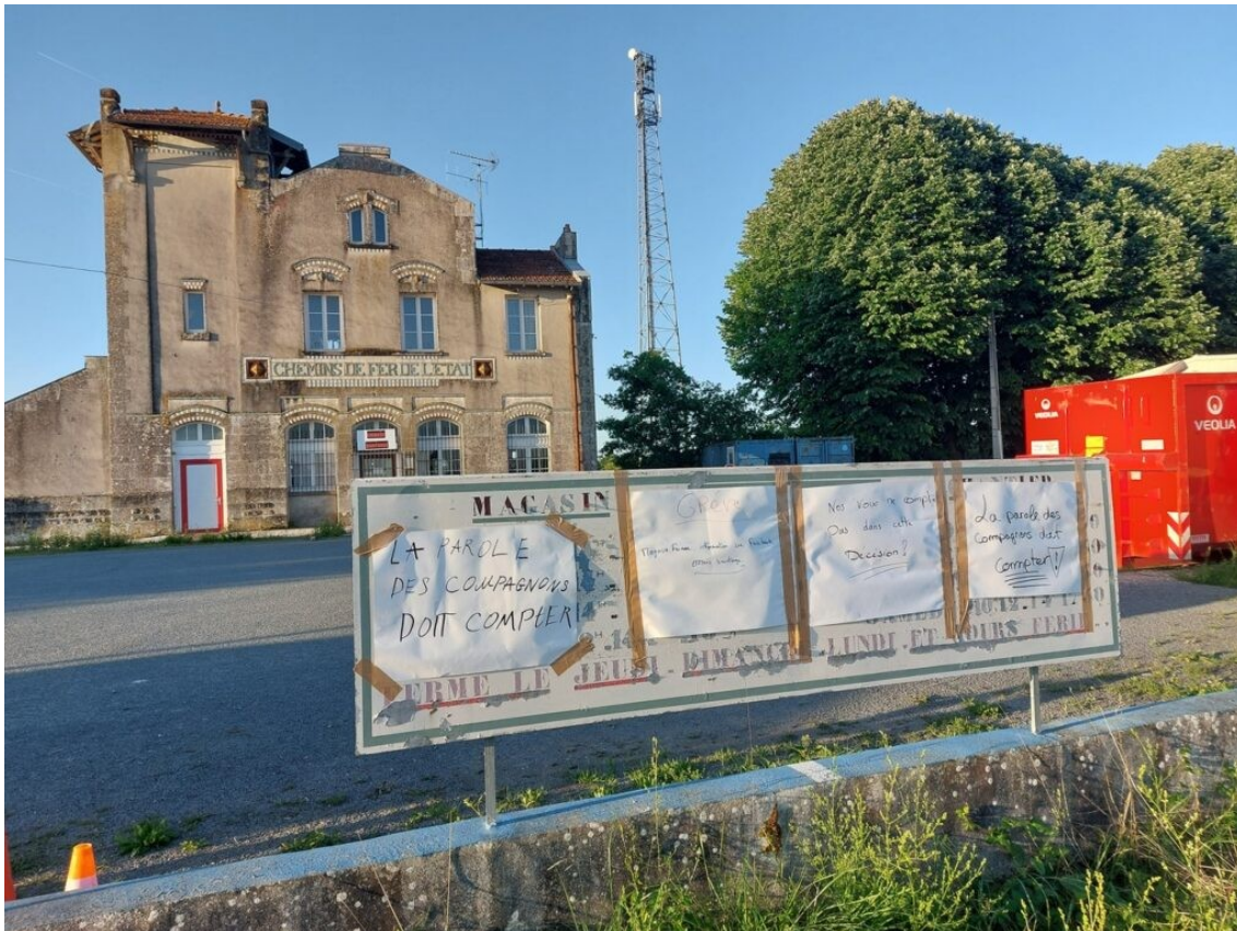
L'ancienne gare de Saint Romain de Benet, aujourd'hui c'est le siège de Emmaüs Saintonge, l'association locale est en conflit avec ses compagnons suite au licenciement de leur responsable, licenciement jugé abusif par les compagnons.