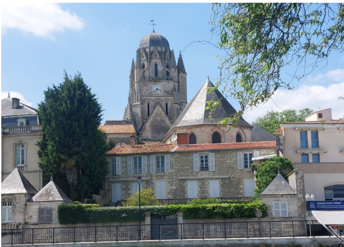
La cathédrale de Saintes.