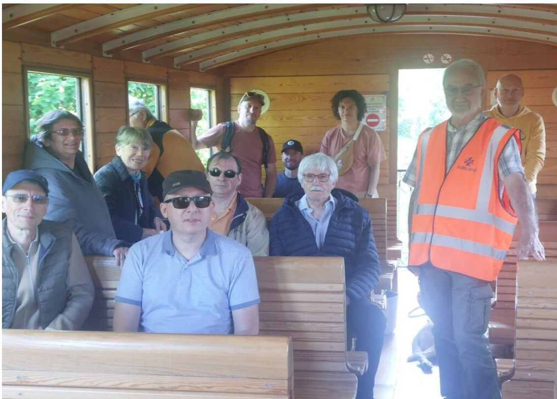
Quelques Amis de Railccorp