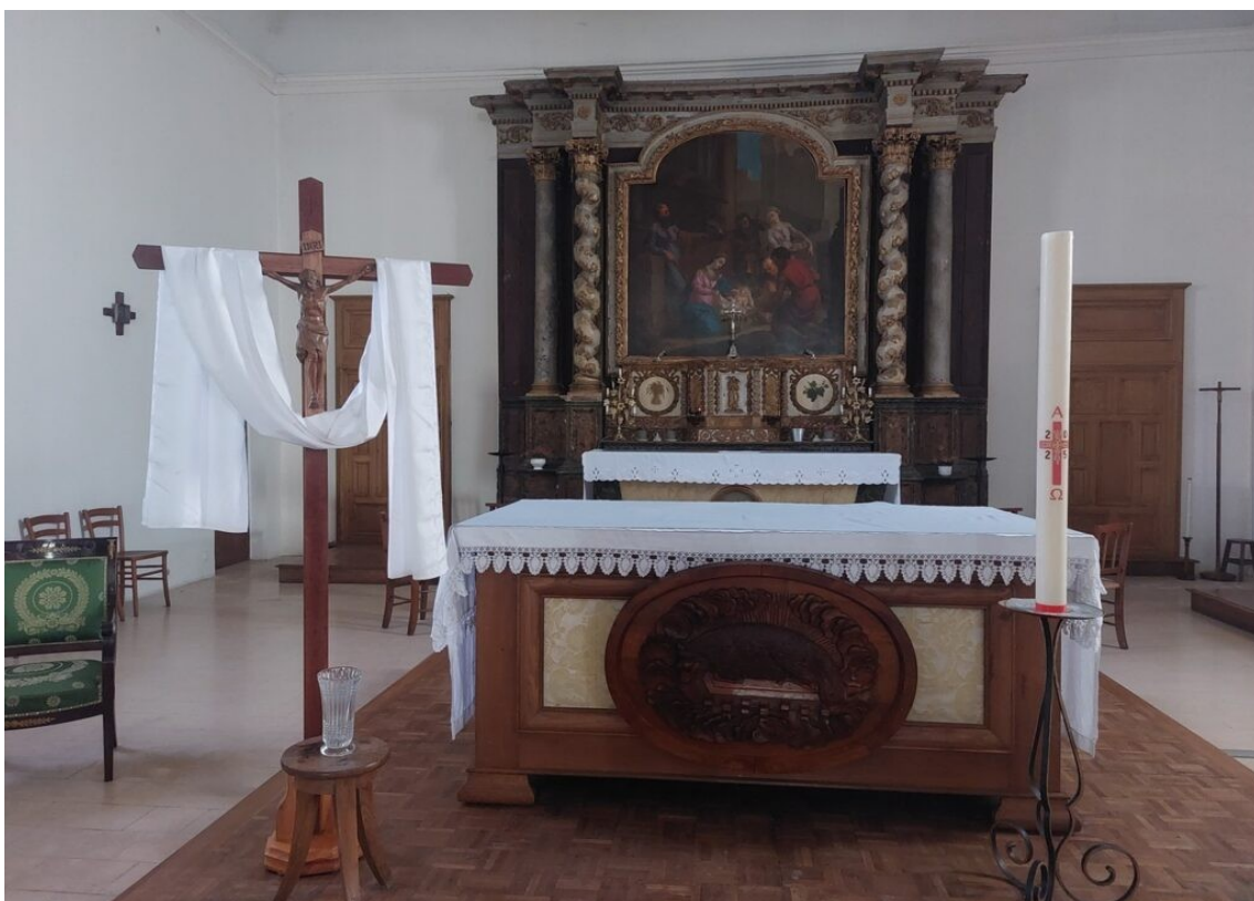
L'église de Charron.