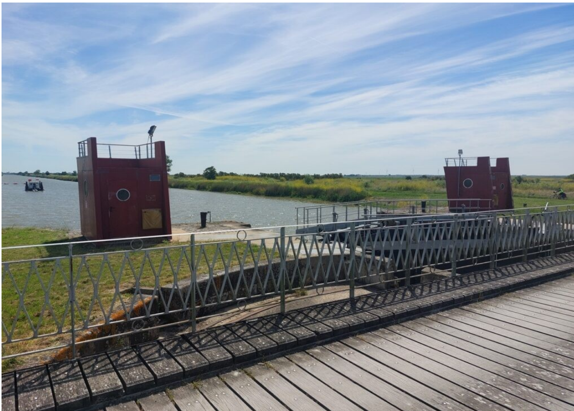
Écluse du Brault.