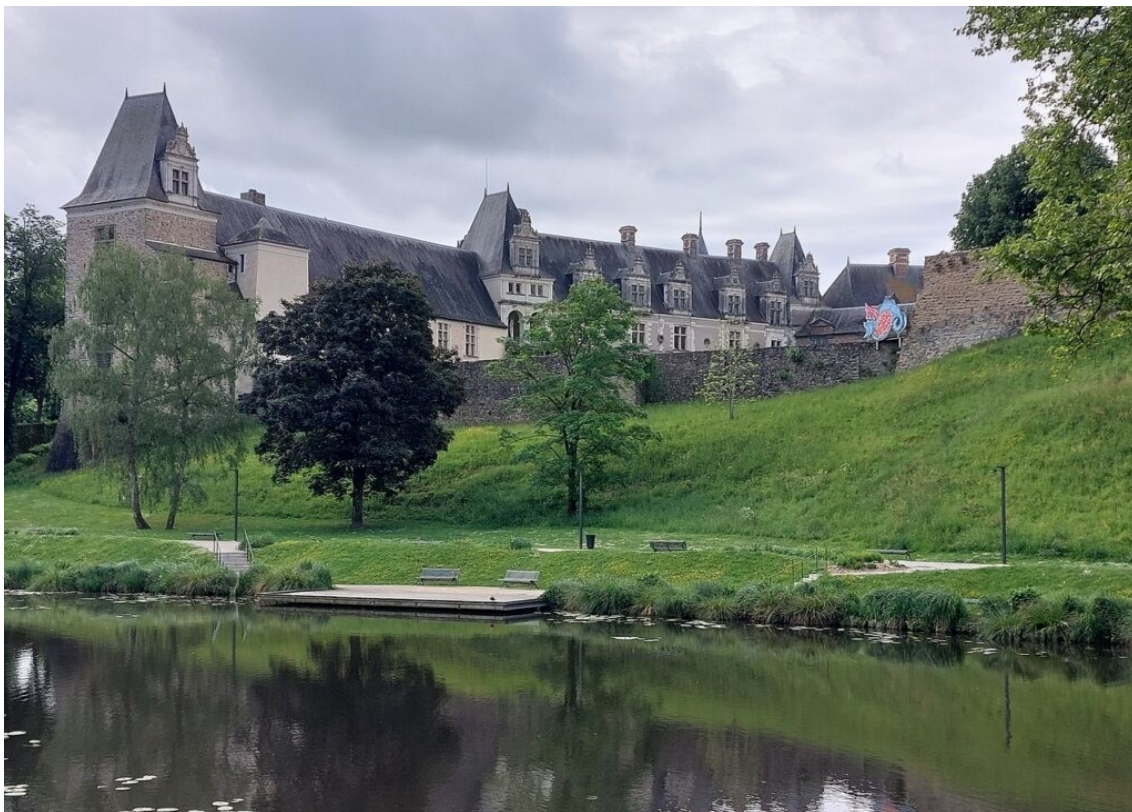
Le château de Châteaubriant.