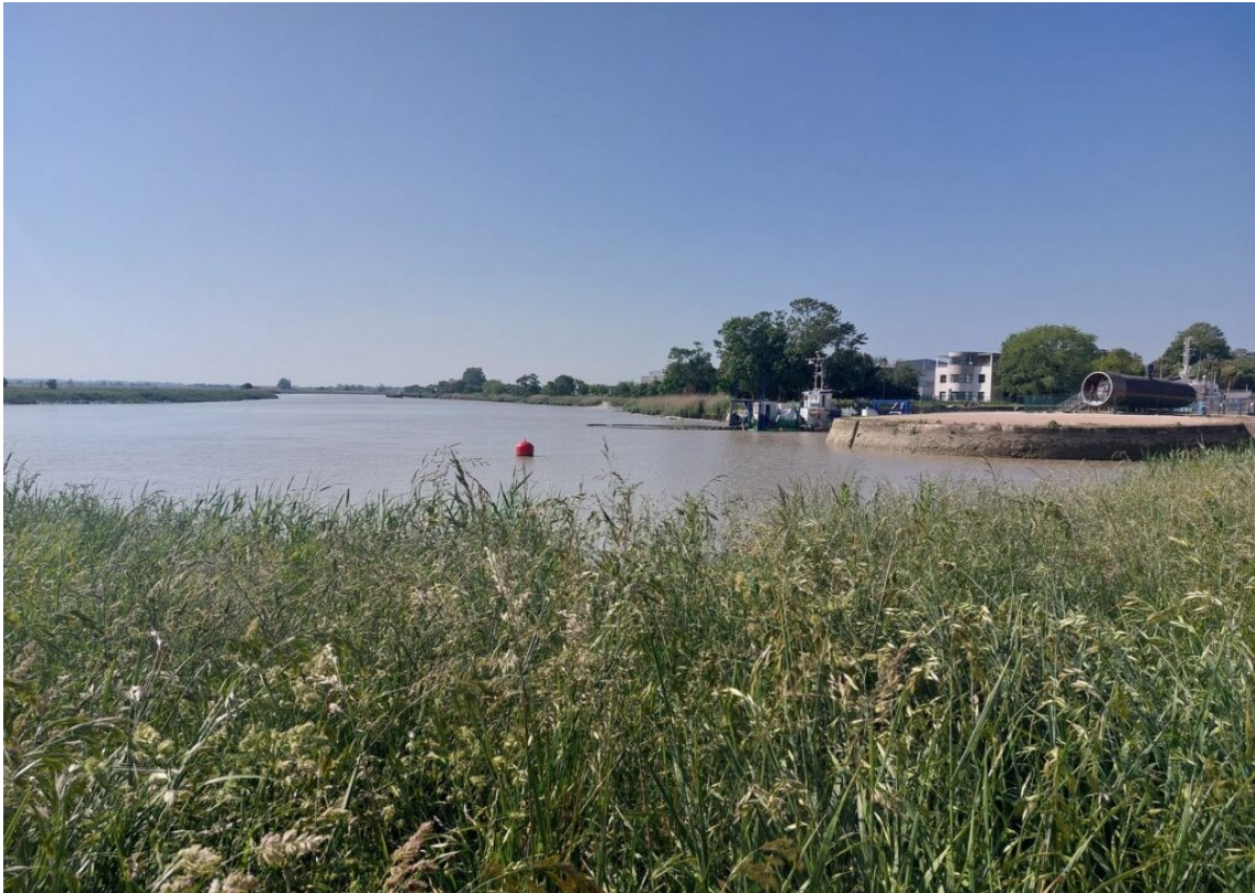
La Charente à Rochefort.