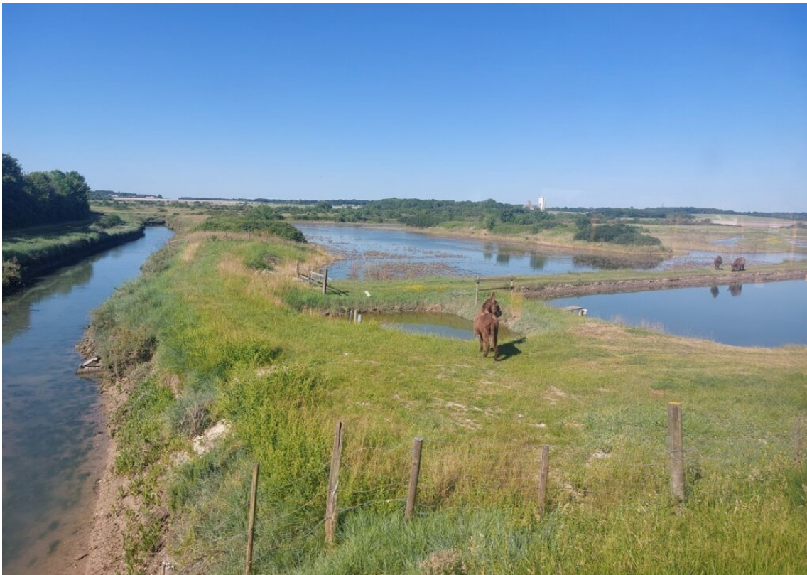
Les marais salants de Mornac sur Seudre.