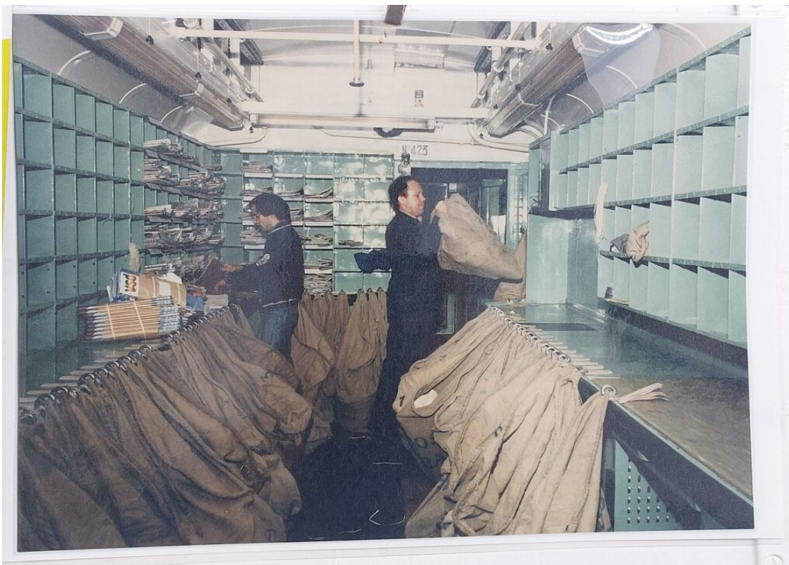
Petite exposition en gare de la Tremblade sur le travail du tri postal dans les trains de nuit.