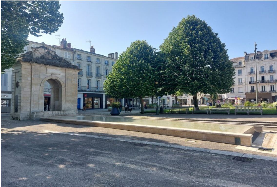
Place Colbert à Rochefort.