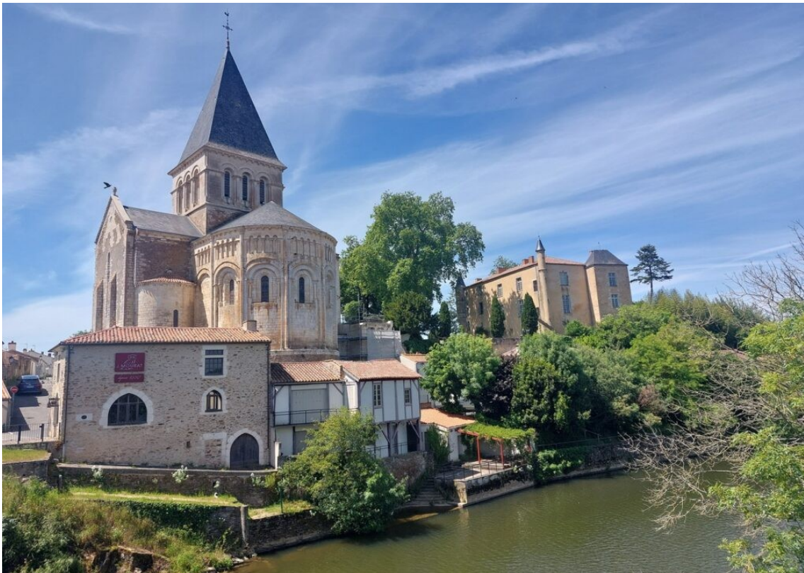
Mareuil sur Lay.