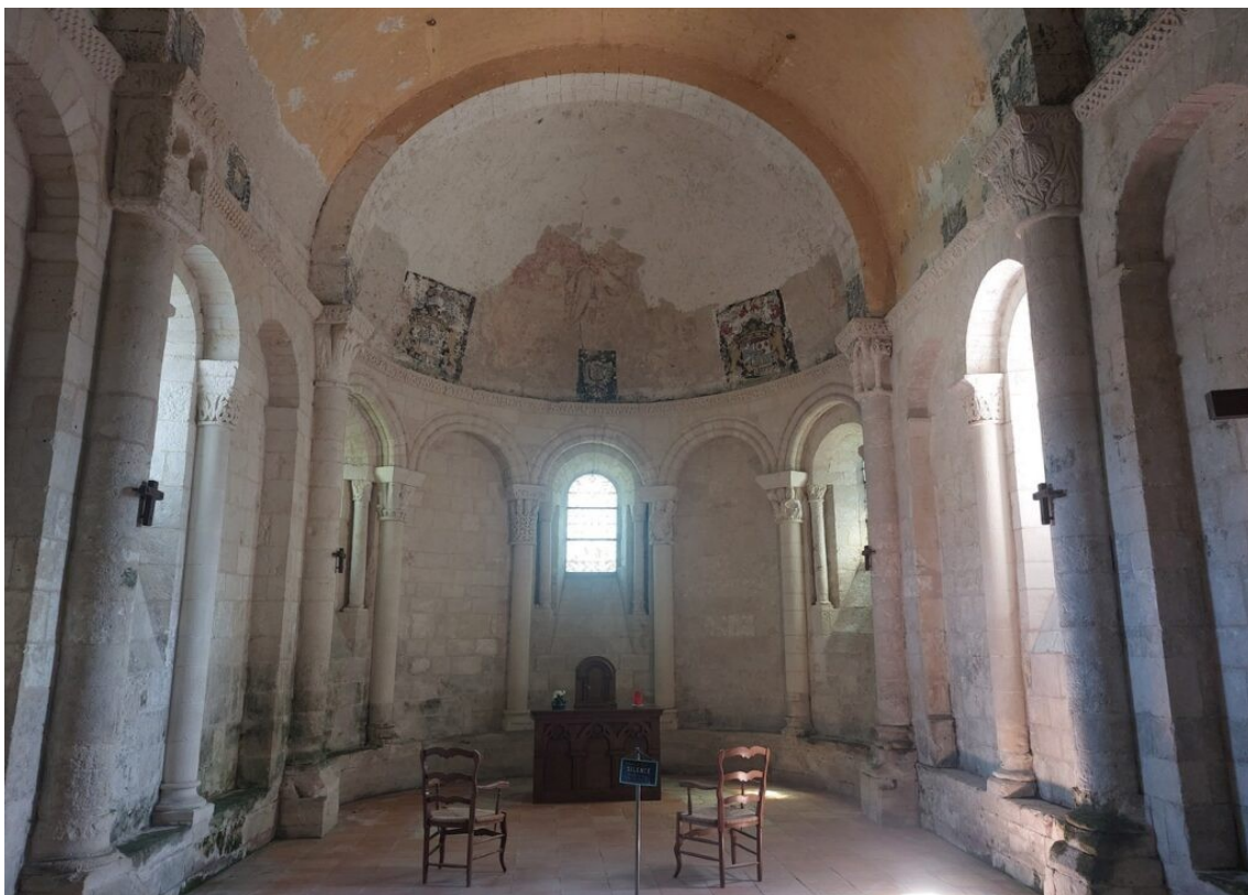
L'église de Mornac sur Seudre.