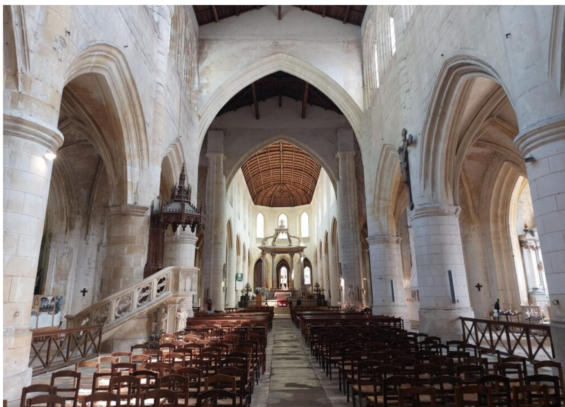
La cathédrale de Saintes.