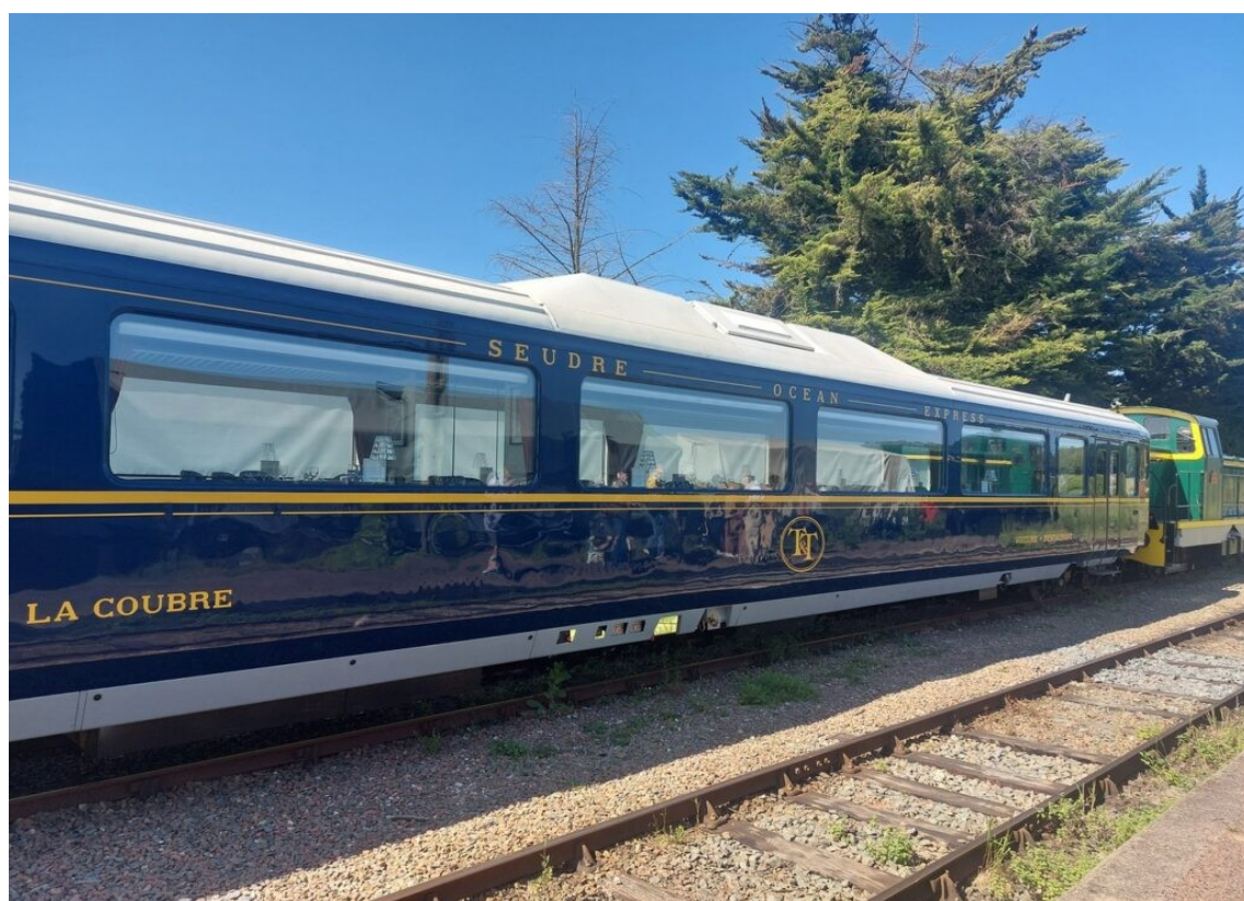
Une des voitures restaurant du Seudre Ocean Express.

La ligne est utilisée toute l'année par le Seudre Ocean Express , restaurant gastronomique fonctionnant 3 fois par semaine. Restaurant offrant 42 couverts pour 85 € par personne. Plus de 25 000 repas servis depuis septembre 1921. Les réservations sont déjà complètes pour les 3 mois à venir.