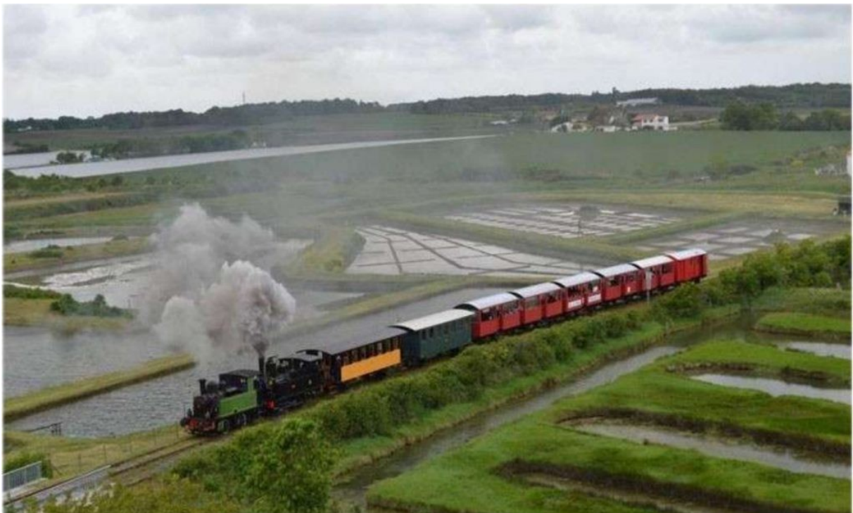
Le train des Mouettes