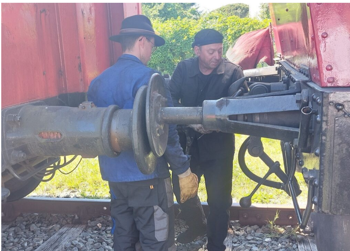
Décrochage de la locomotive à La tremblade avant de lui faire faire son demi-tour.