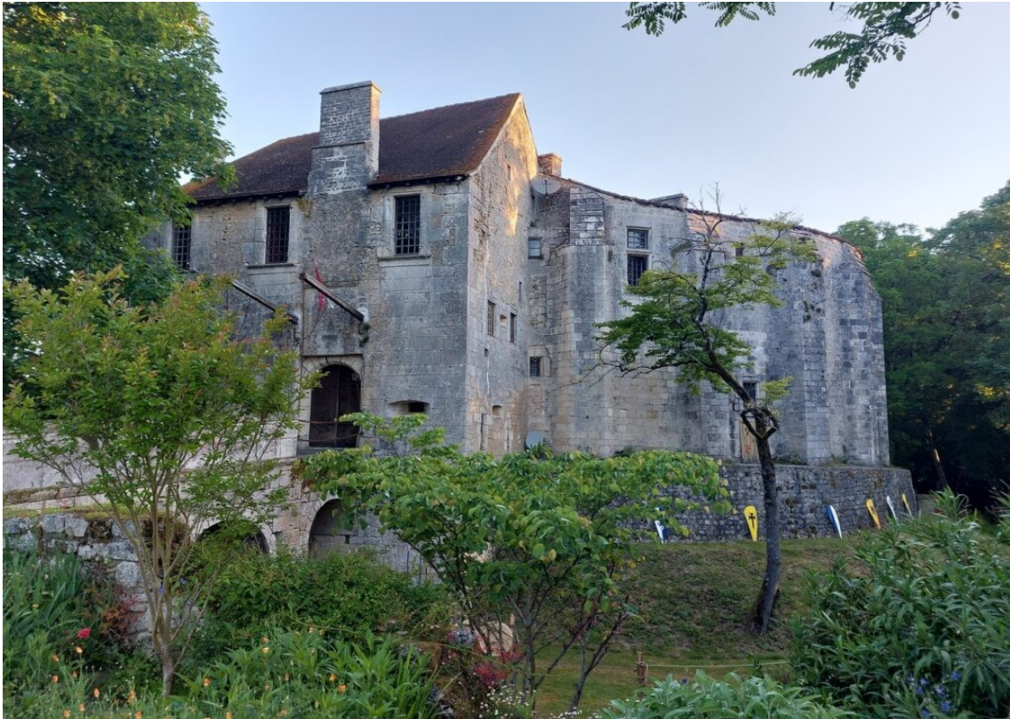
Le château de Pisany.