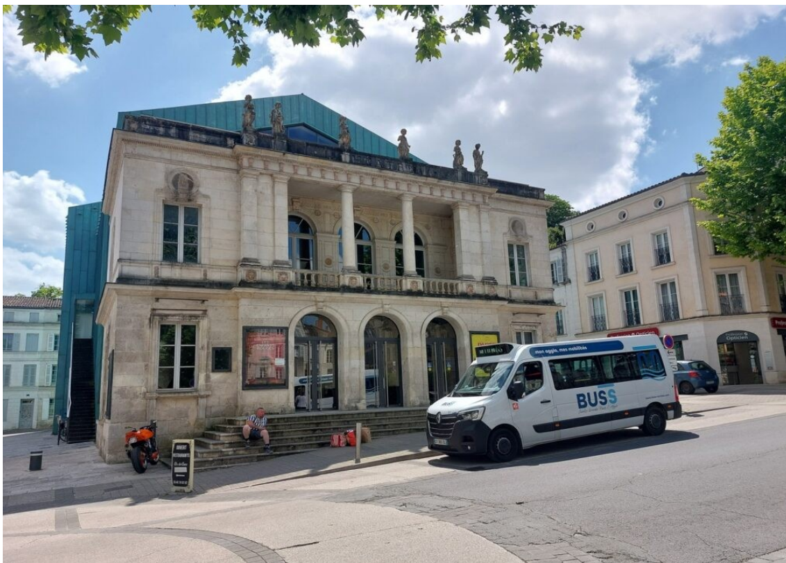
Le théâtre de Saintes.