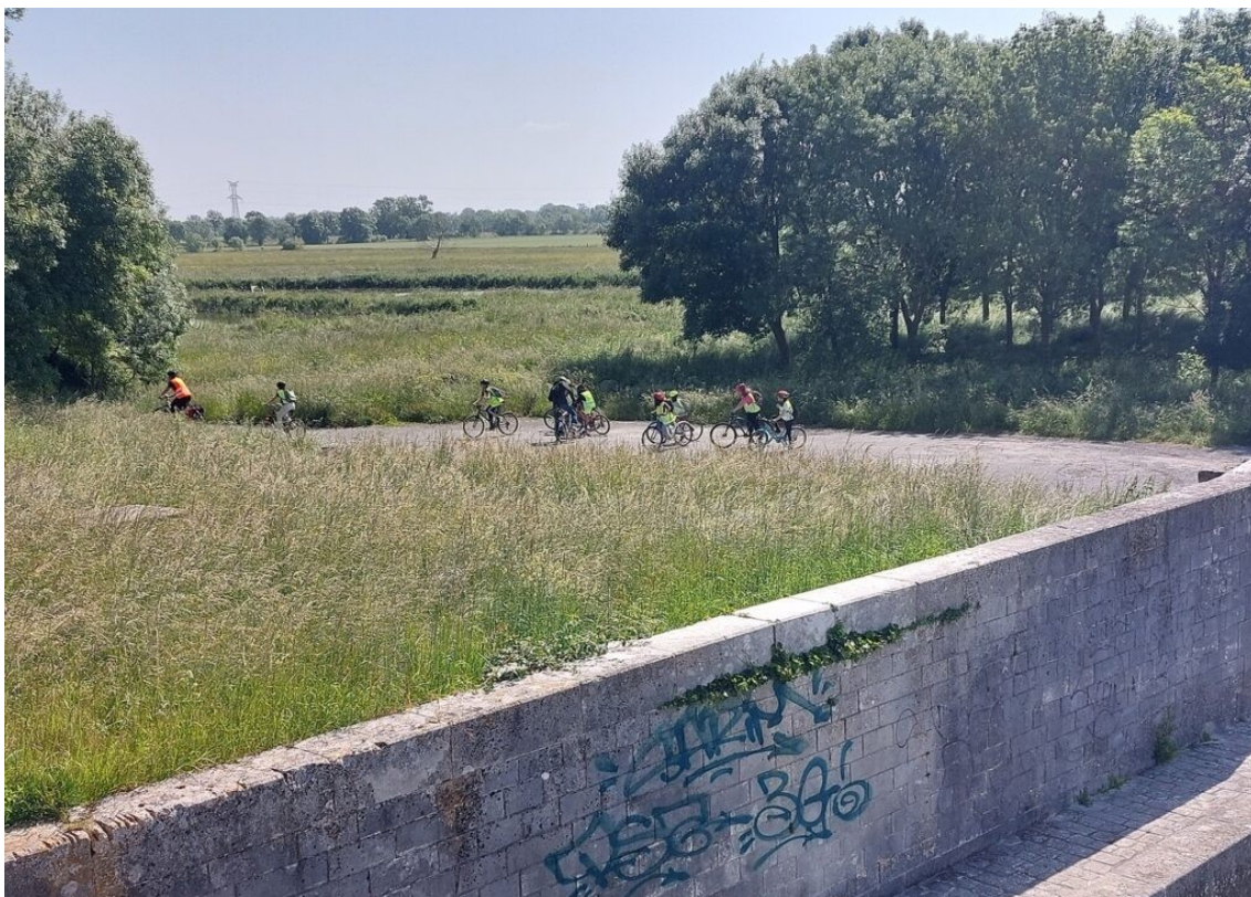
Sortie scolaire en bord de Charente.