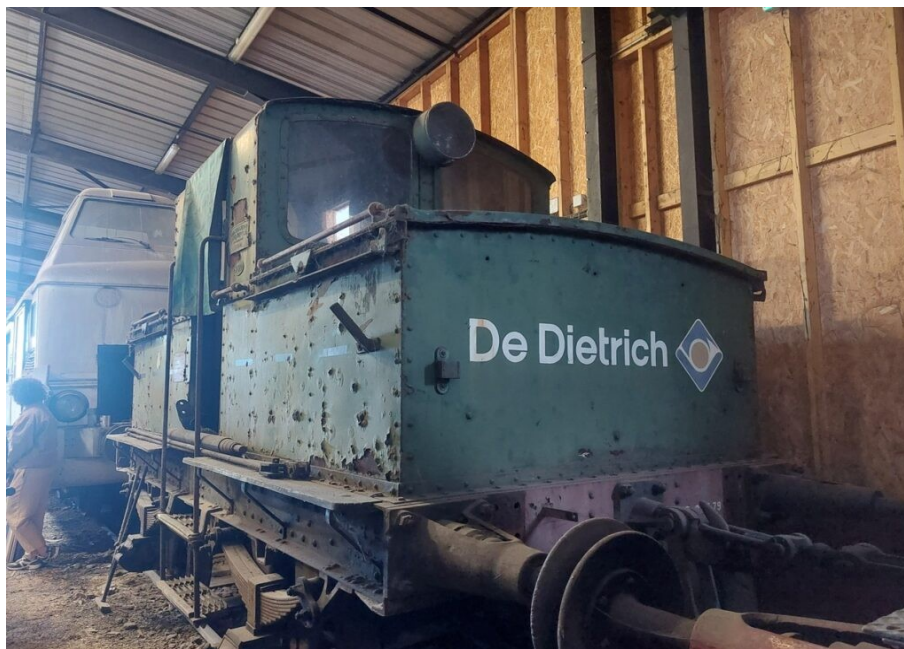
Vieille loco électrique (sur batterie) en attente de restauration.