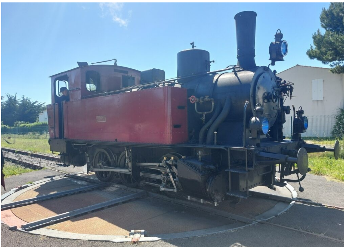
La locomotive sur la plaque tournante de La Tremblade.