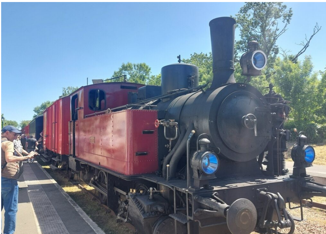
L'arrivée du train en provenance de Saujon, direction La Tremblade.