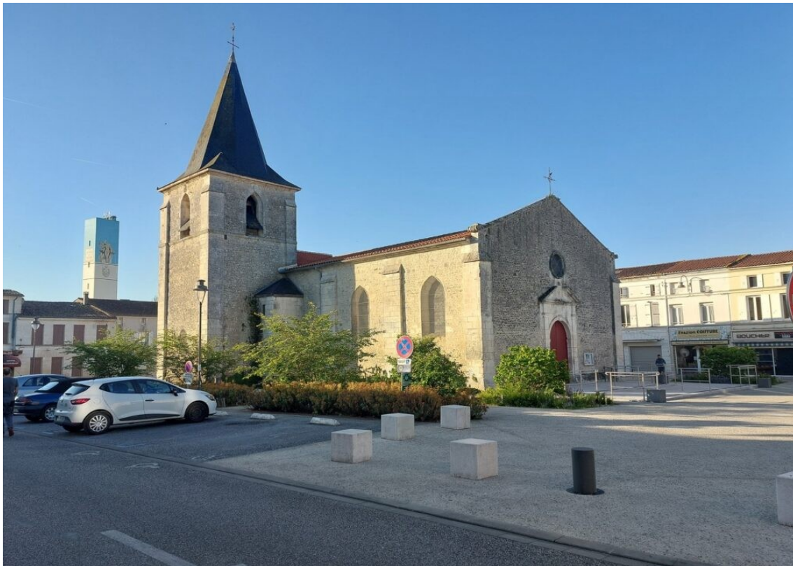
L'église de Saujon.