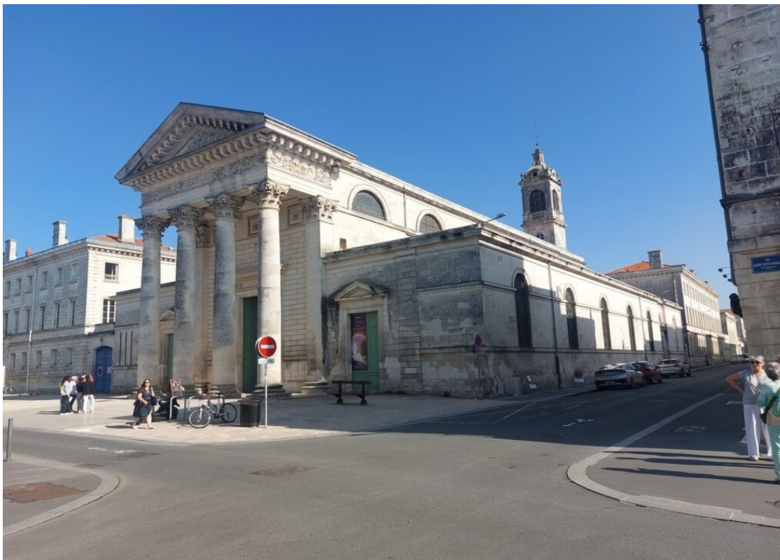
L'église Saint Louis à Rochefort.