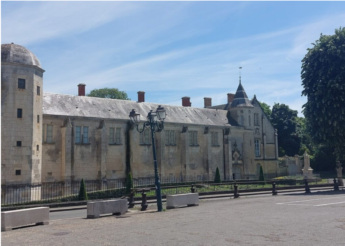
L'évêché de Luçon.