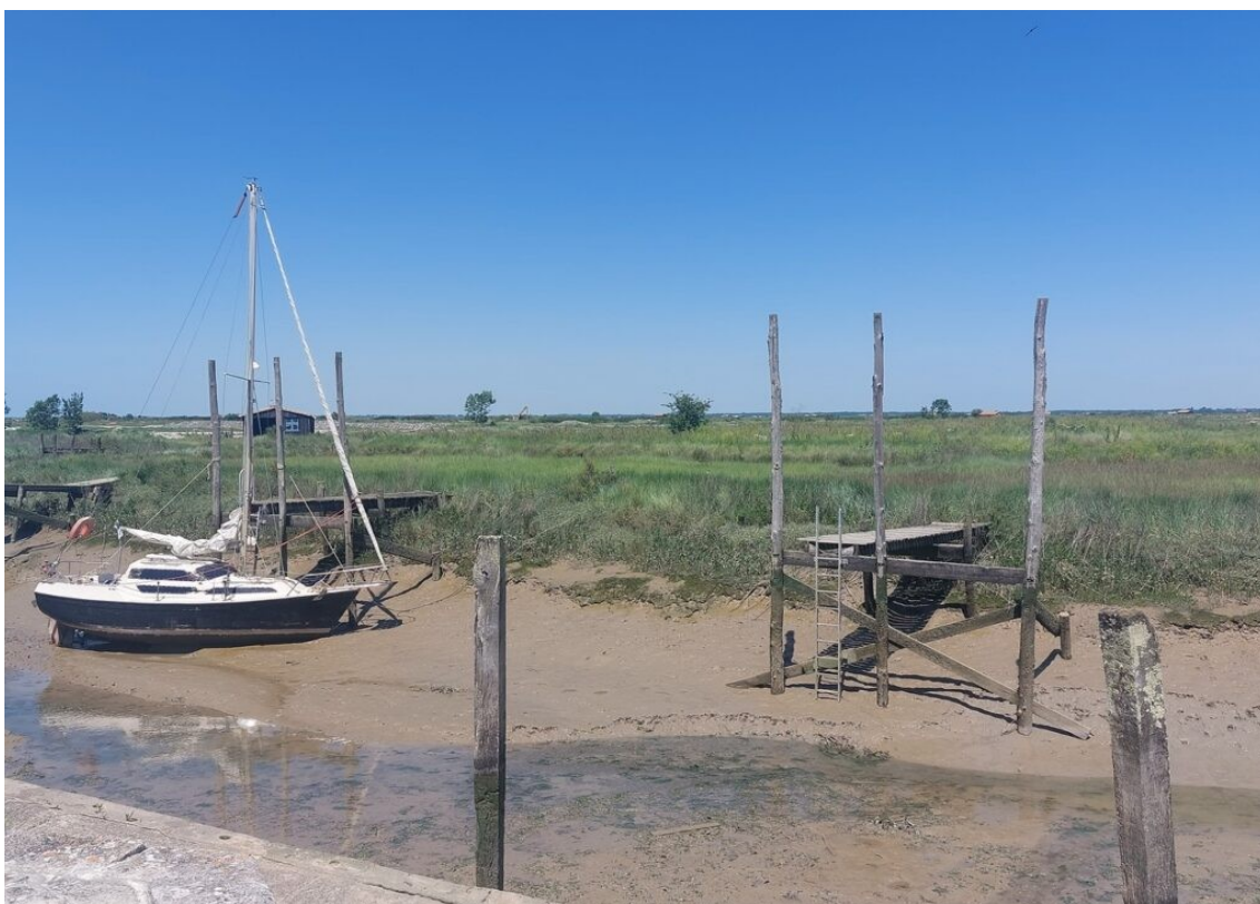
Le chenal de Mornac qui permet de relier le petit port de Mornac à la Seudre.