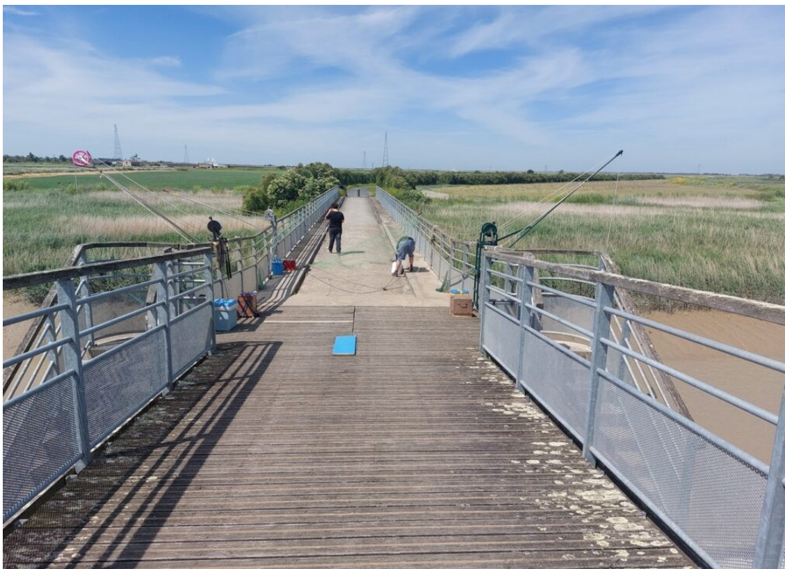
La passerelle du Brault qui permet aux piétons et cyclistes de franchir la Sèvre Niortaise. C'est un point de pêche au carrelet. Cette passerelle est sur l'itinéraire de la Vélodyssée, véloroute qui permet d'aller de Roscoff en Bretagne à Hendaye au Pays Basque.