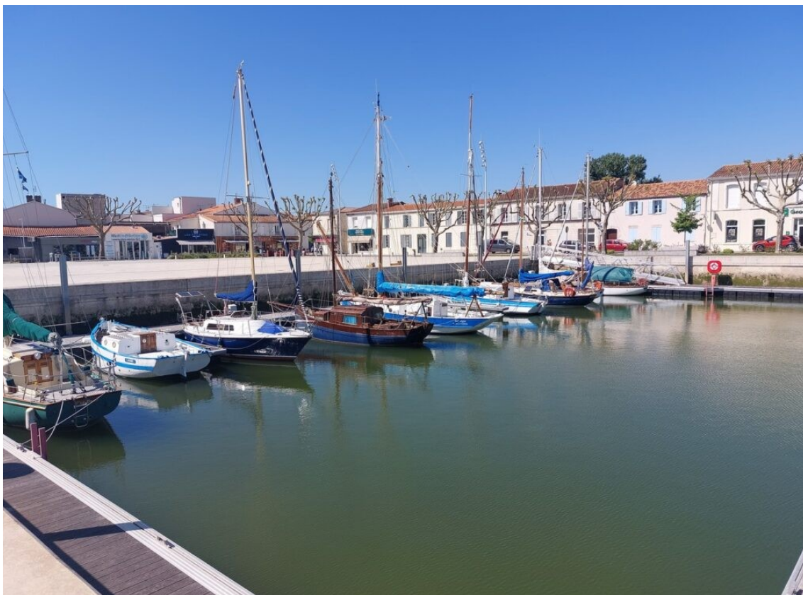
Le bassin en eaux profondes du port de la Tremblade. L'entrée-sortie de ce bassin ne peut se faire qu'à marée haute.