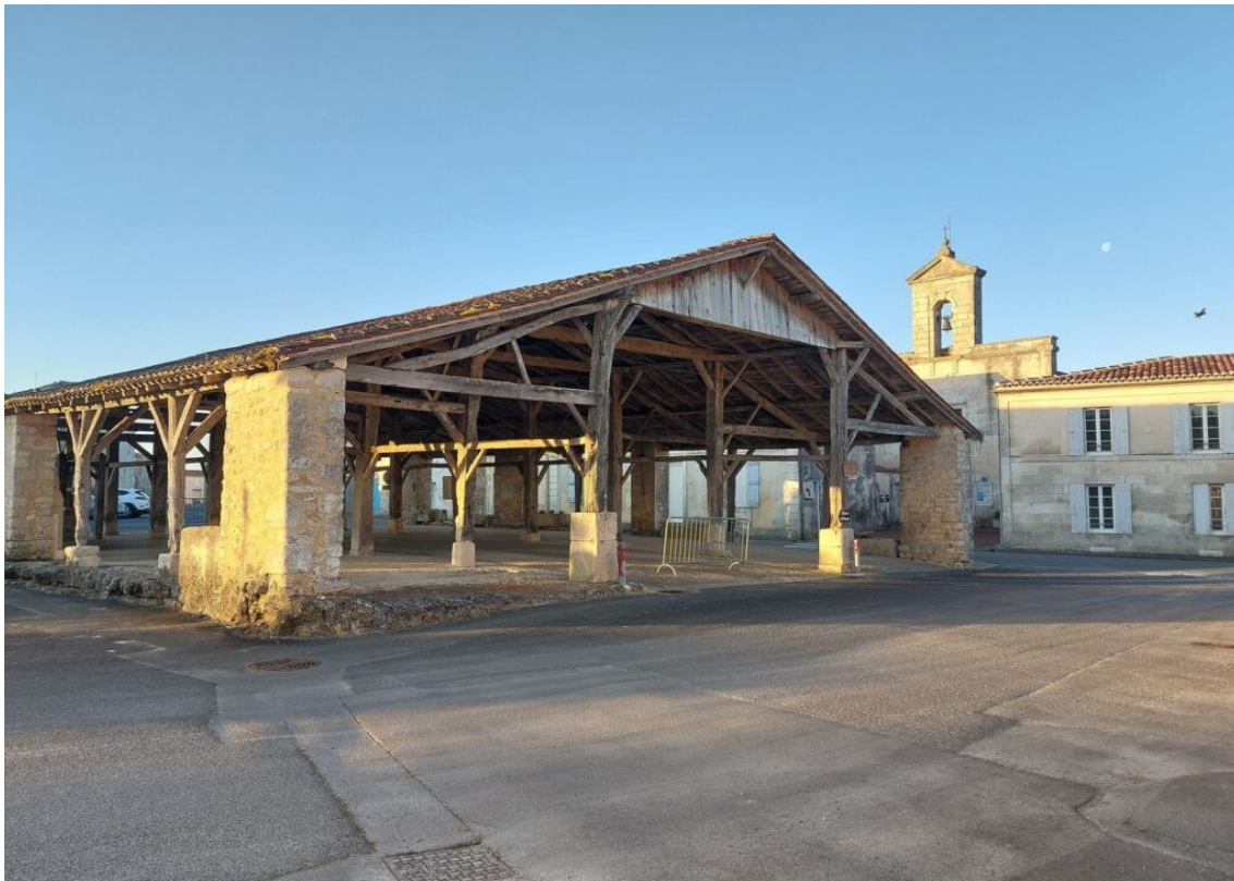
La halle de Pisany.