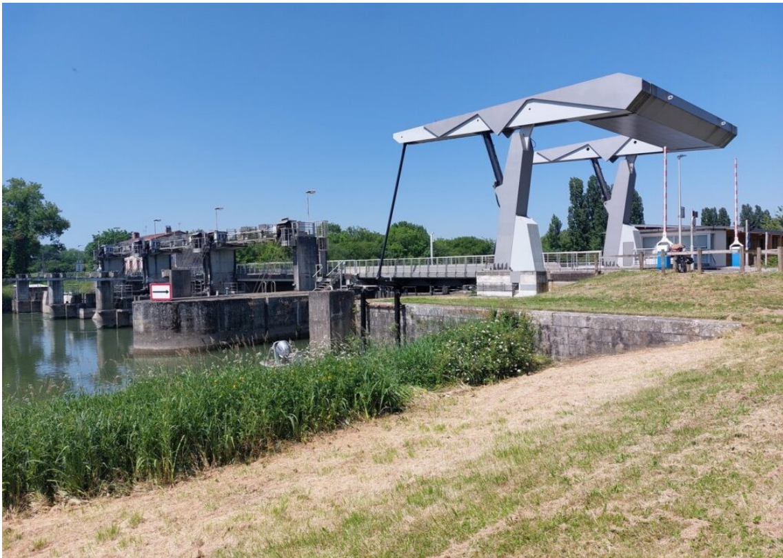
Le barrage-écluse de Saint Savinien.