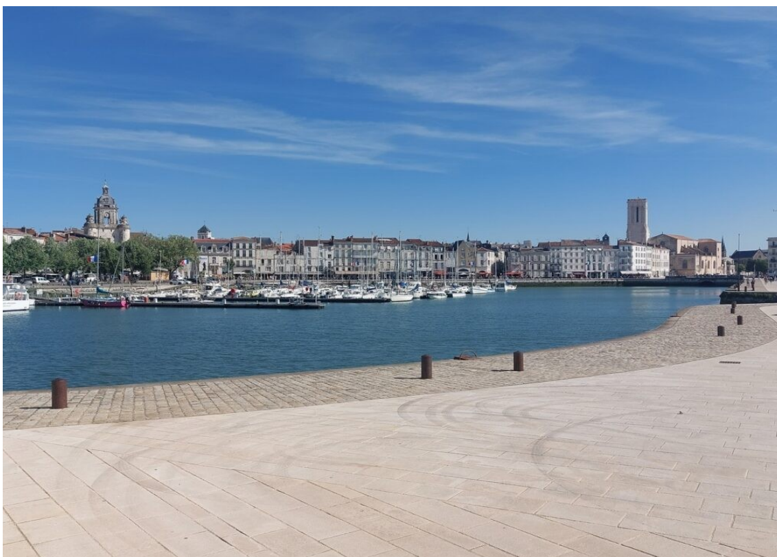
Le port de La Rochelle.