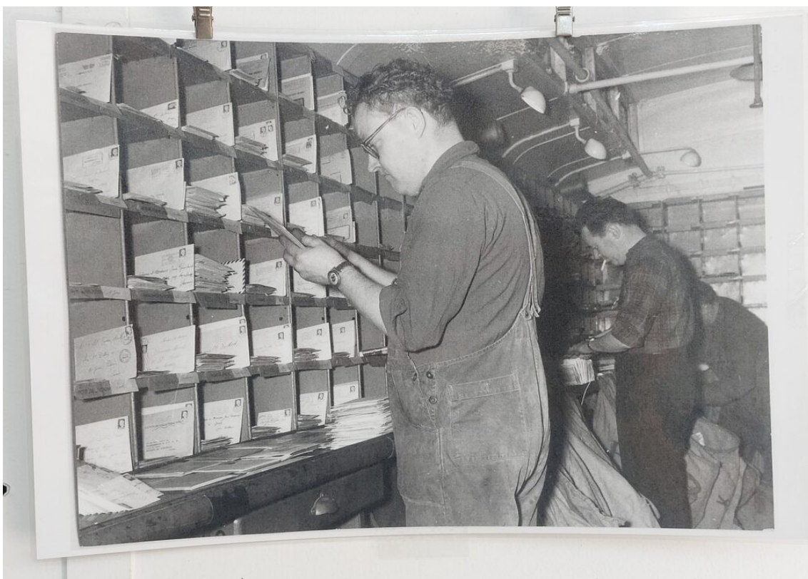
Petite exposition en gare de la Tremblade sur le travail du tri postal dans les trains de nuit.