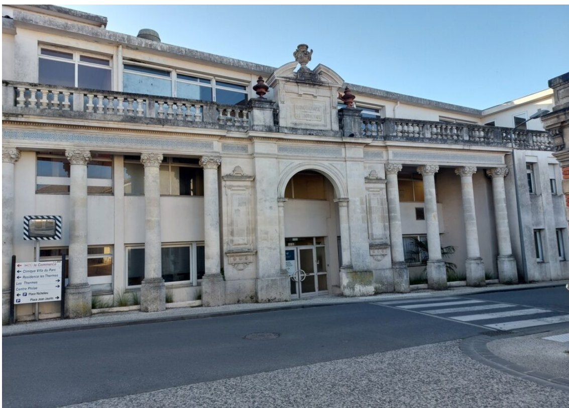
Les thermes de Saujon.