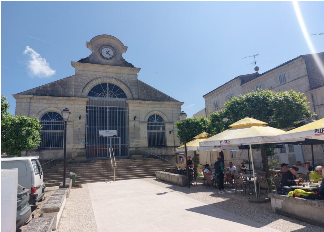
Le marché de Saint Savinien.