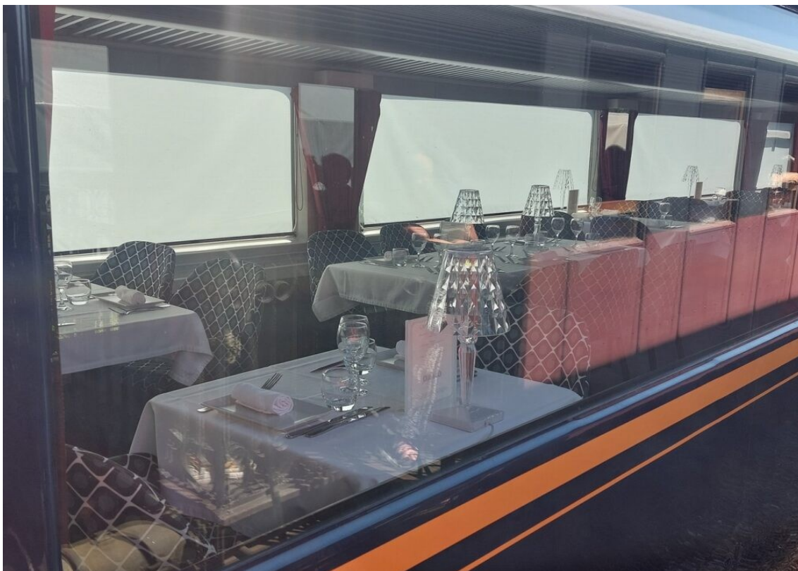
Une des voitures restaurant du Seudre Ocean Express.