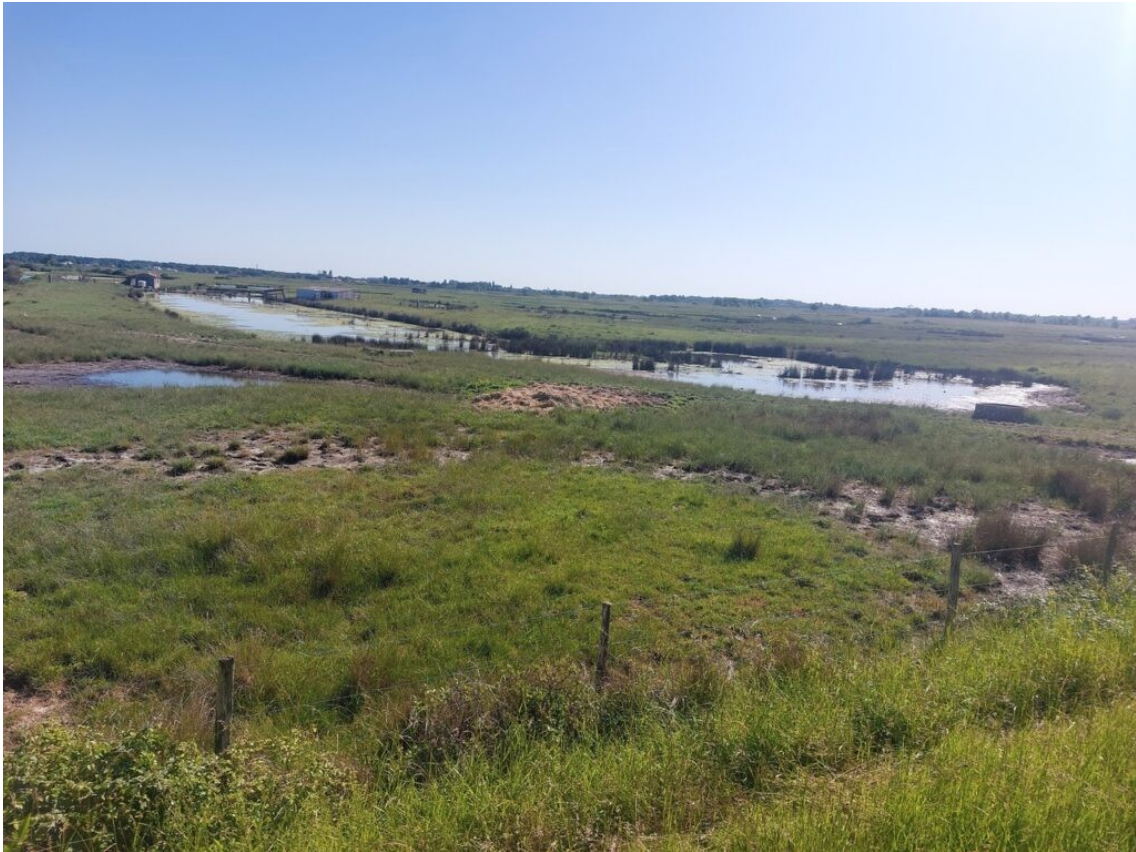
Le marais de la Seudre. La Seudre est un fleuve côtier de 68 km de long. Ruisseau avant Saujon, il s'élargit peu après et ses eaux deviennent salées, la mer remontant jusqu'à Saujon à marée haute. Dans le marais de la Seudre composés d'anciens marais salants, sont installées les claires qui permettent l'affinage des huîtres.