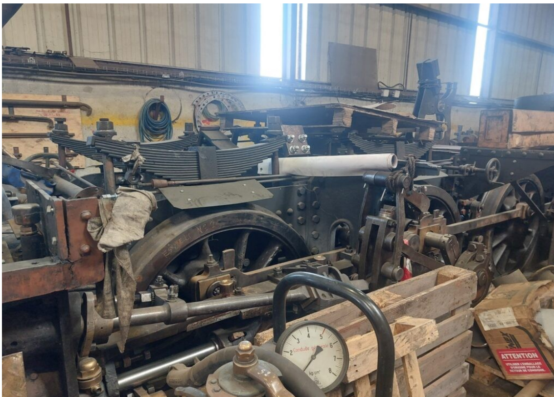
Locomotive à vapeur en cours de remontage.