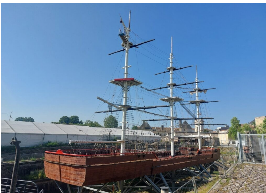
Ce n'est pas l'Hermione, la frégate construite en 2014 à Rochefort, réplique du navire de guerre français l'Hermione, un trois-mâts carré, en service de 1779 à 1793. Elle est en grand carénage au port de Bayonne.