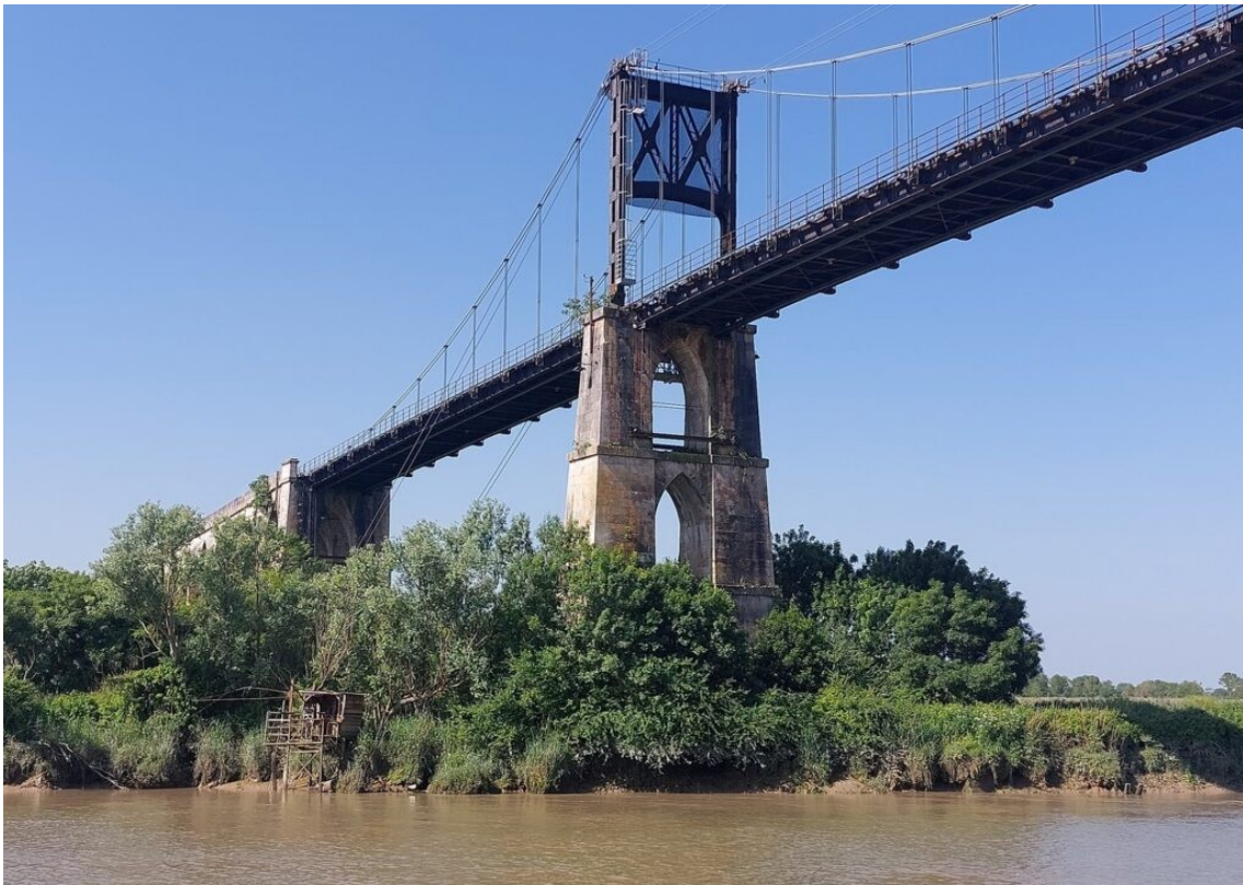
Le pont suspendu de Tonnay-Charente.