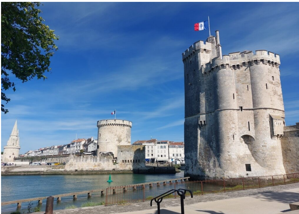
Le port de La Rochelle.