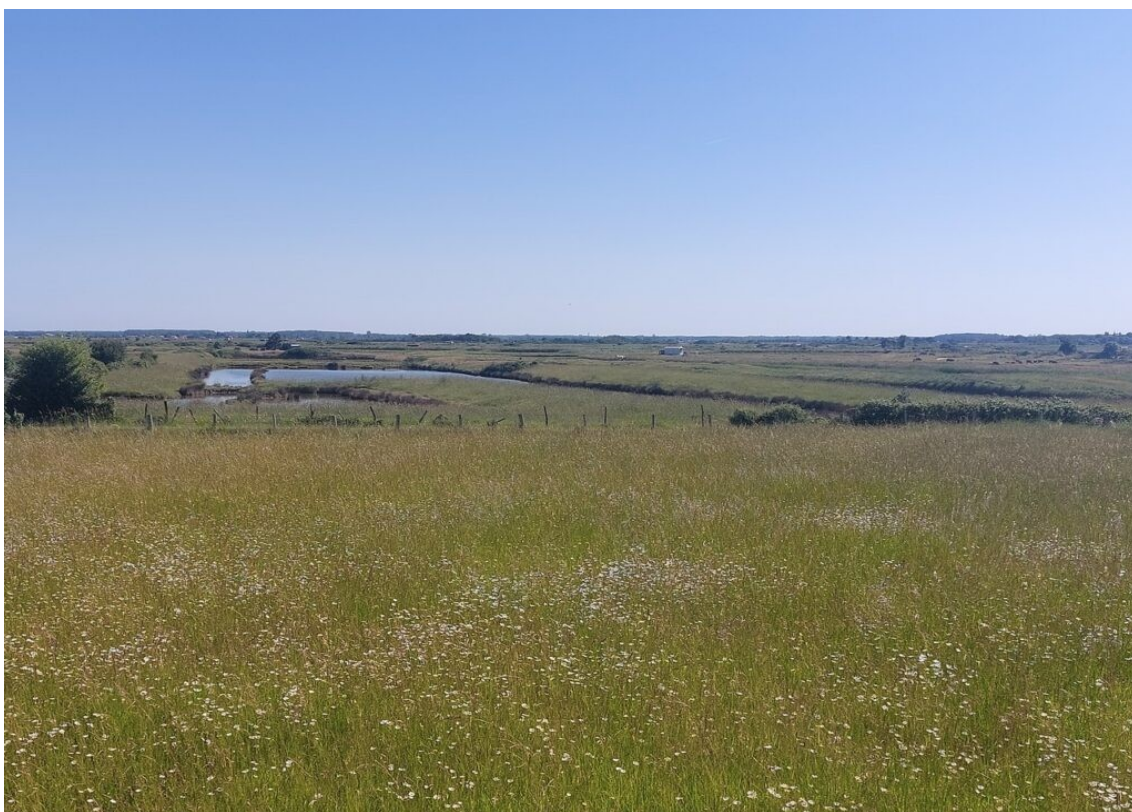
Le marais de la Seudre.