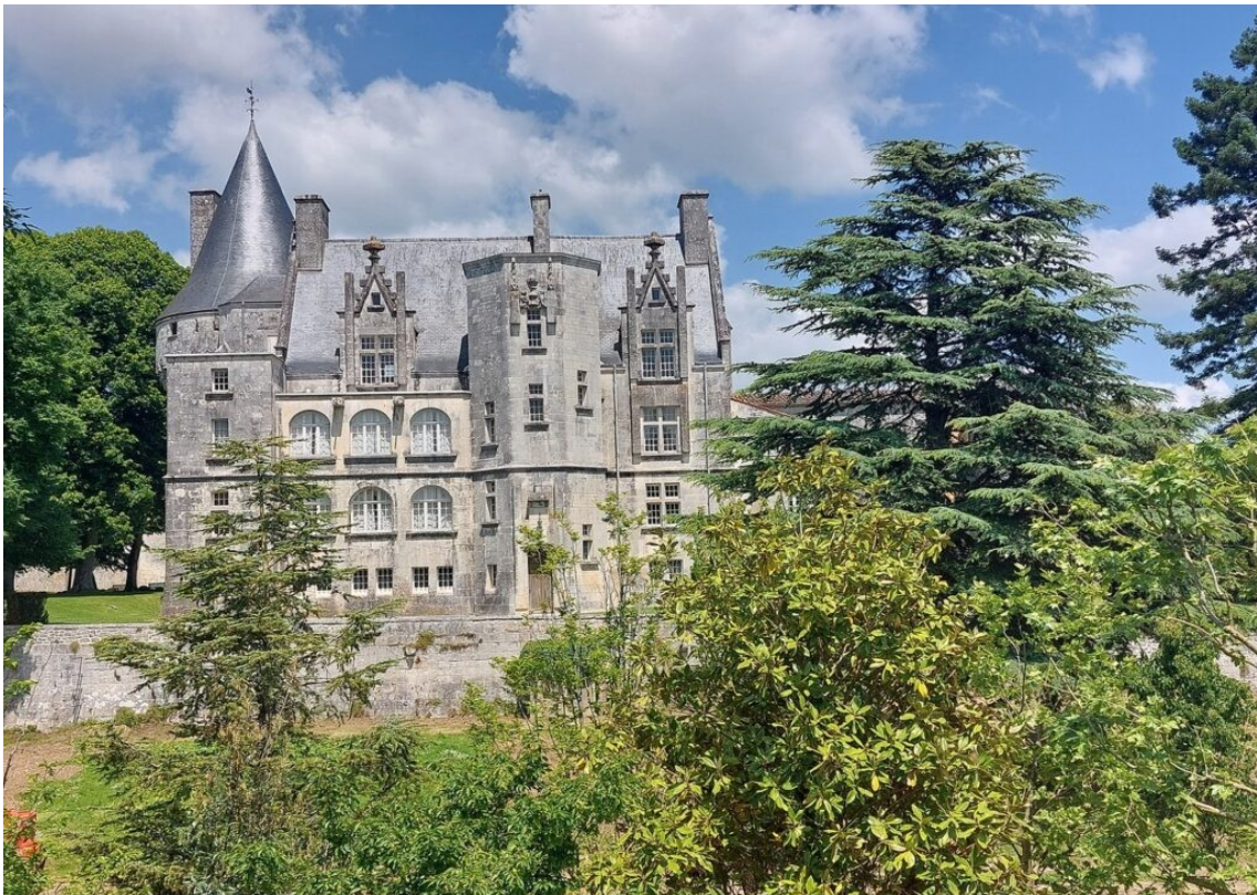
Le château de Crazannes.