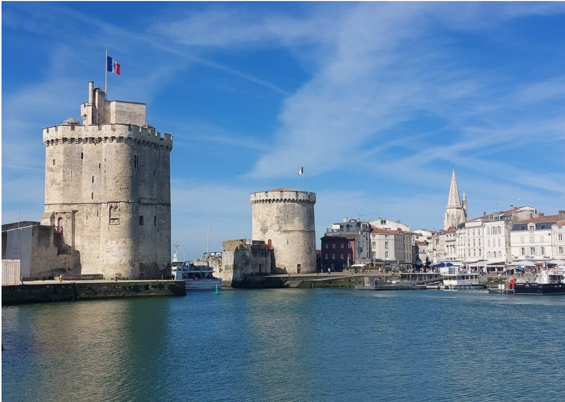
Le port de La Rochelle.