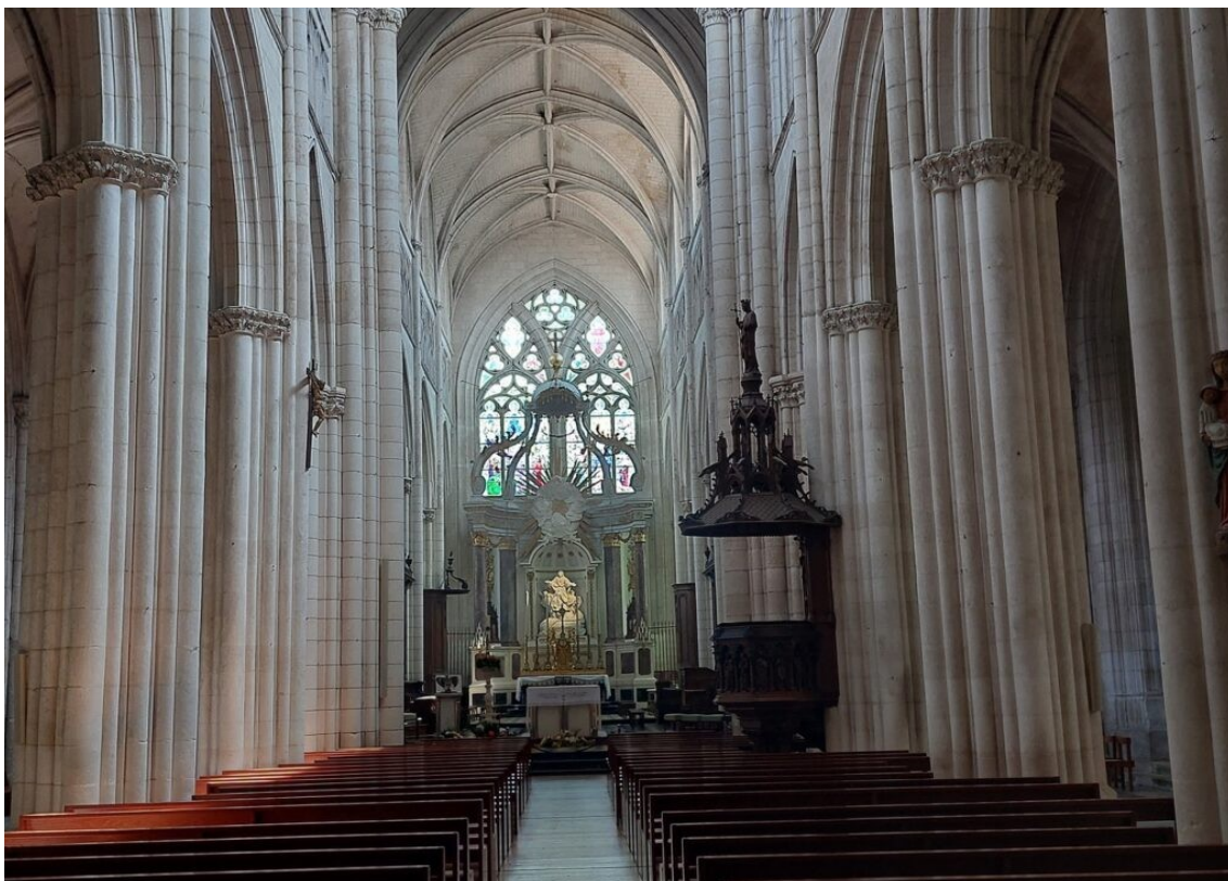
La cathédrale de Luçon.