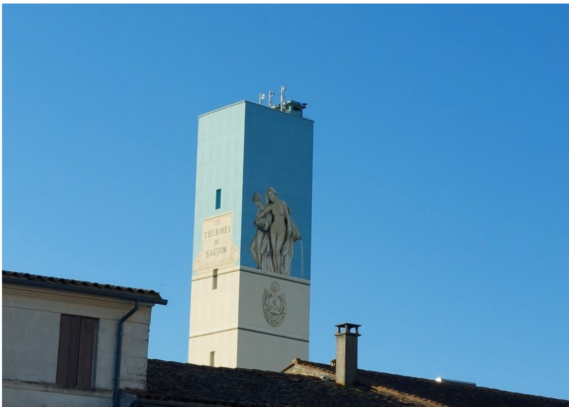
Les thermes de Saujon.