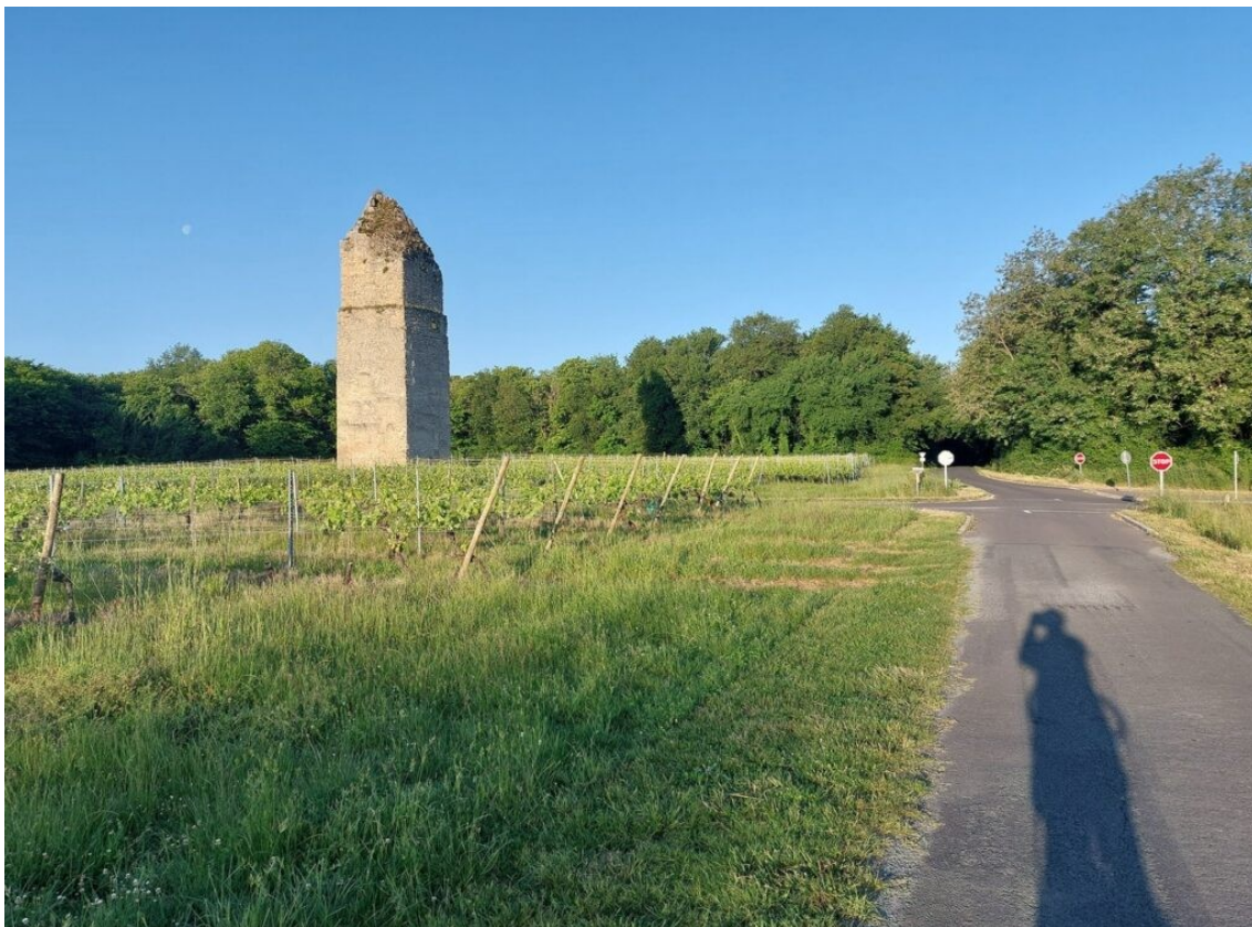
La tour de Pirelonge. Faut-il y voir un fanal, une borne ou un cénotaphe, elle fut édifiée à l'époque romaine.