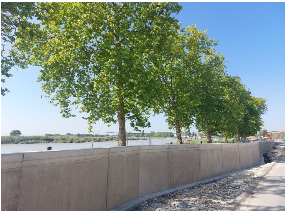
L'adaptation au changement climatique : un mur pour se protéger des crues de la Charente.