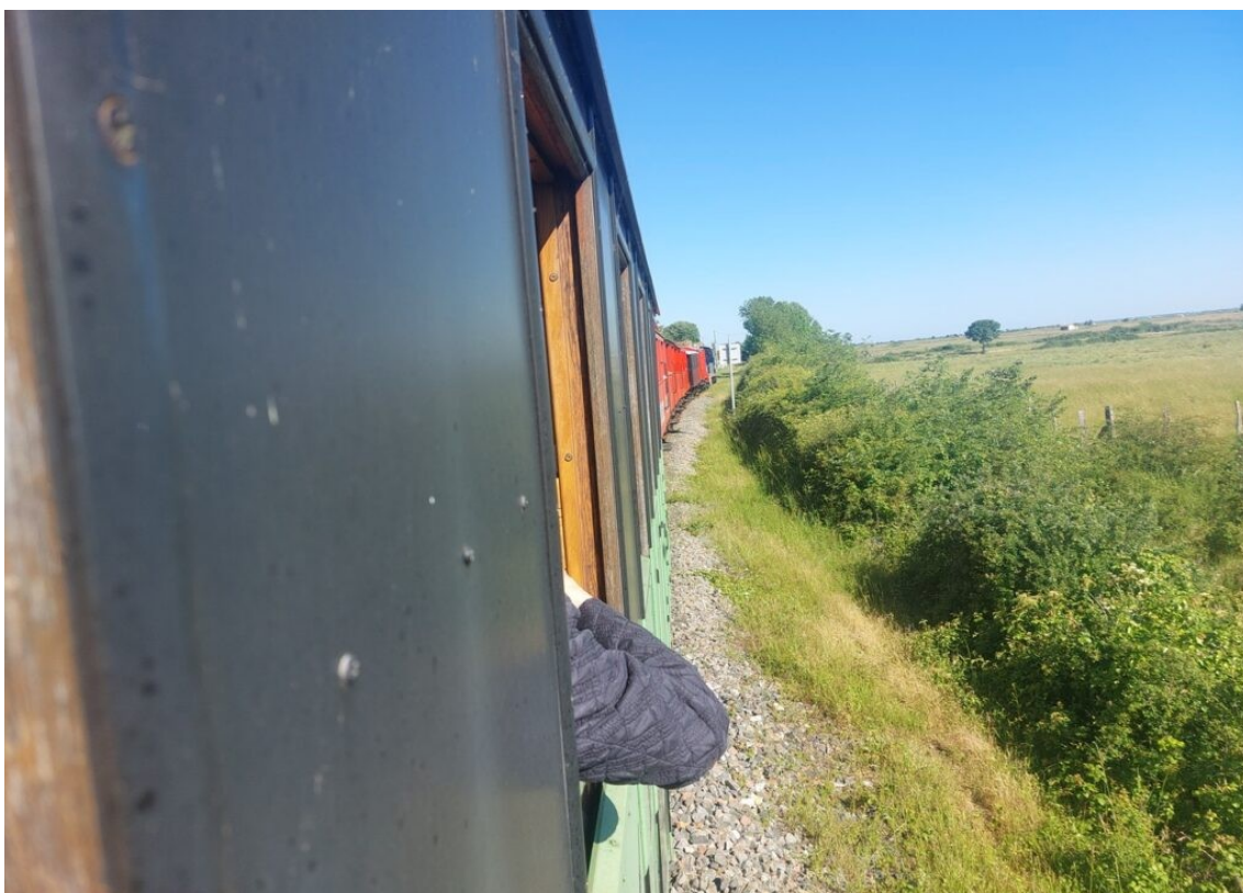
Le train des Mouettes longe le marais de la Seudre.