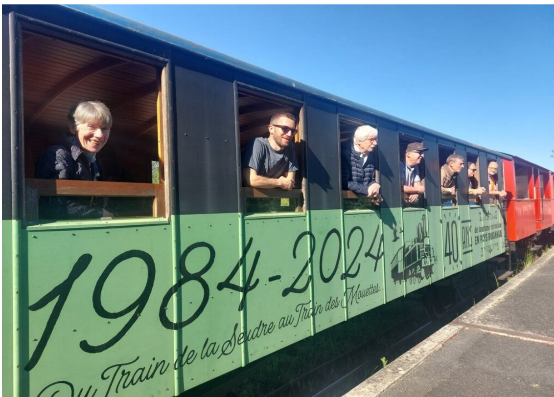
Notre voiture dans le train des Mouettes.