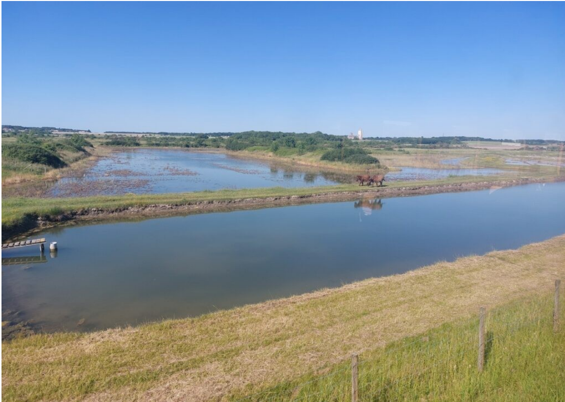
Les marais salants de Mornac sur Seudre.