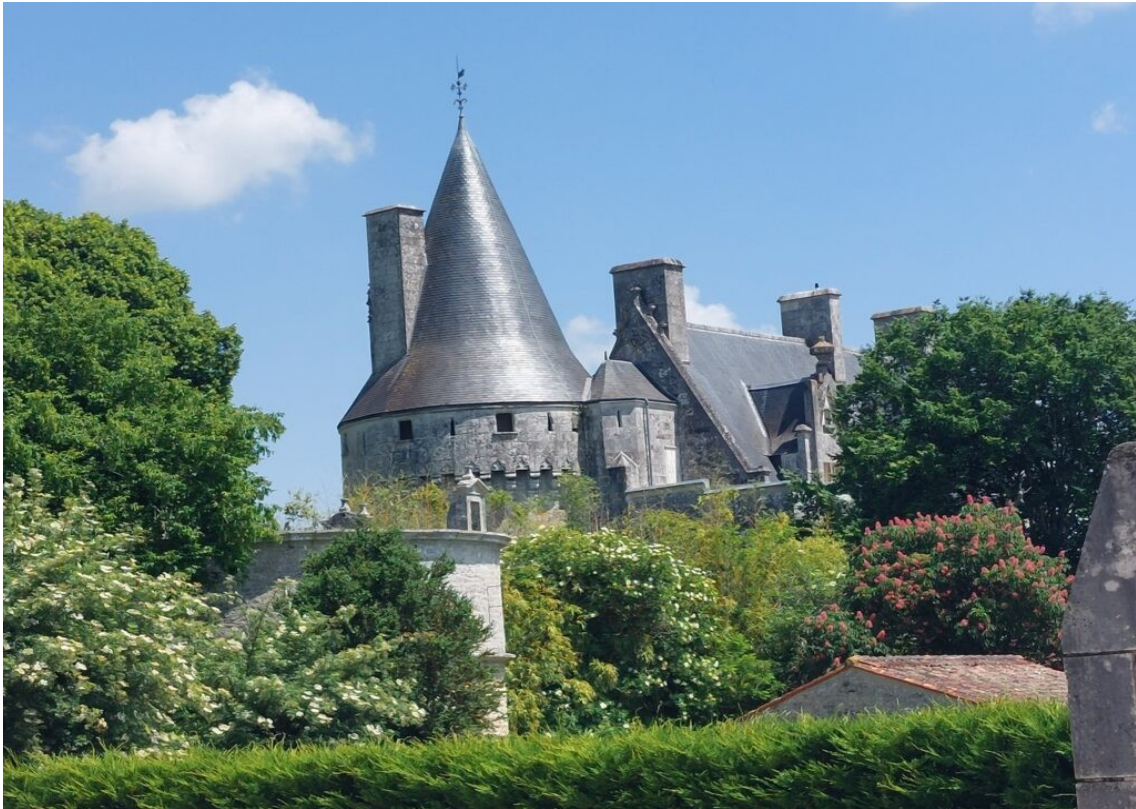
Le château de Crazannes.