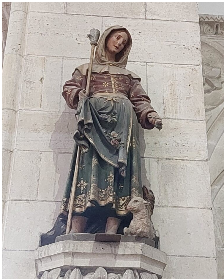
Sainte Germaine de Pibrac, 1579-1601. (Pibrac du côté de Toulouse)