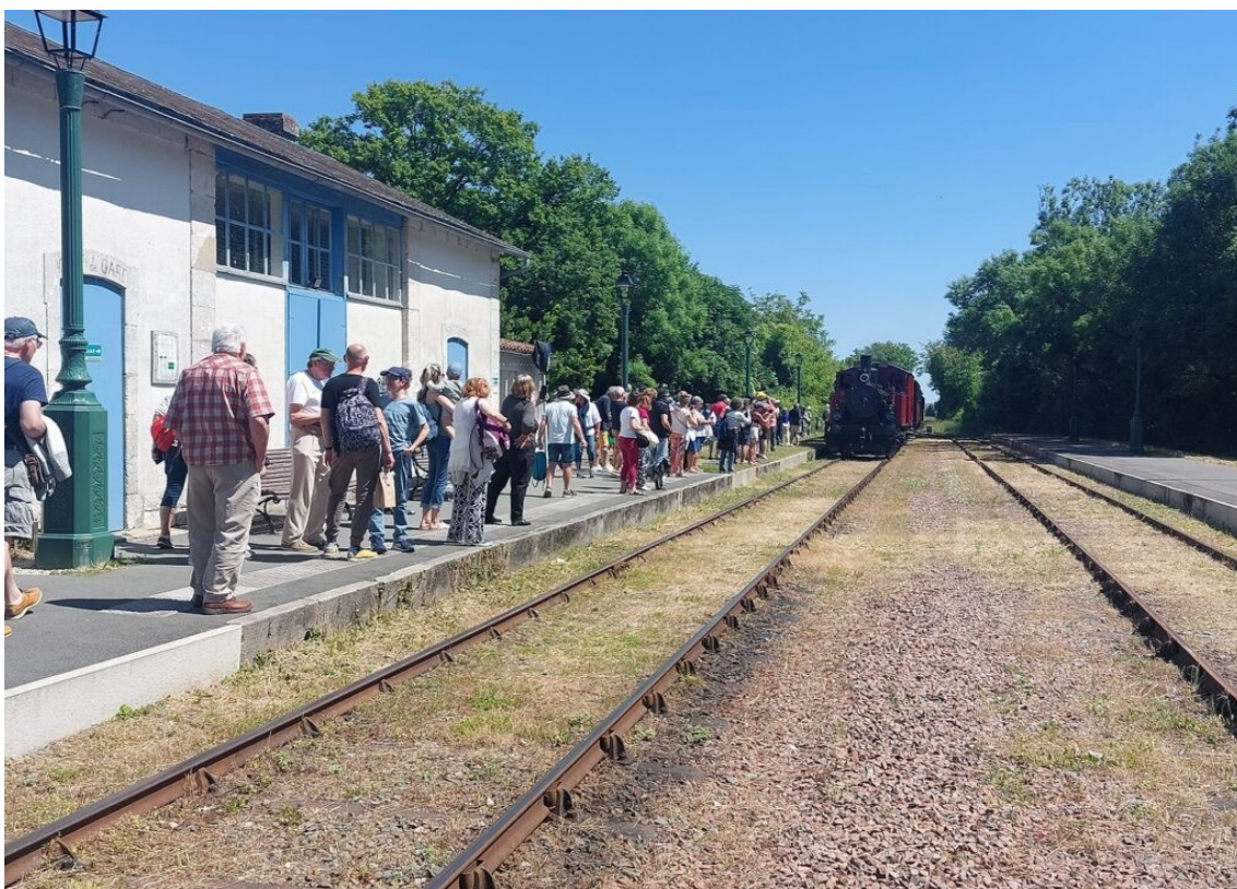
L'arrivée du train en provenance de Saujon, direction La Tremblade.