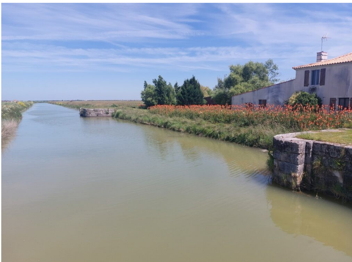
Lieu-dit « Les Portes du Chapitre » à Champagné les Marais sur le canal de Luçon à la mer.