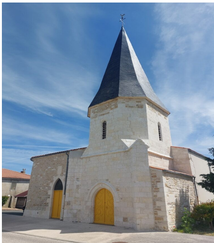
L'église de Charron.