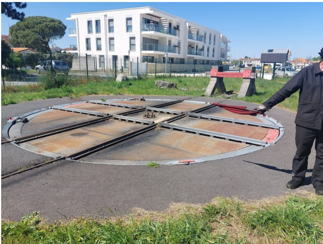
La plaque tournante de la Temblade, cul-de-sac de la ligne Saujon-La Tremblade. La plaque tournante va permettre à la locomotive de faire demi-tour avant de se repositionner en tête de train.