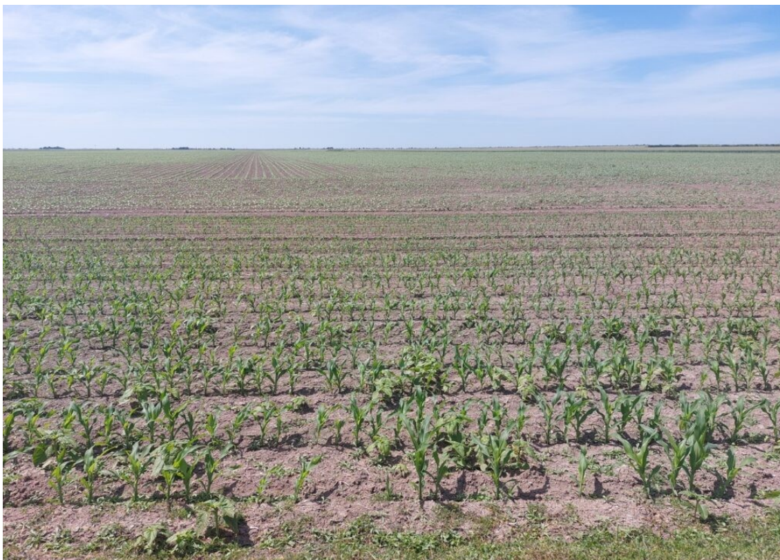
Du maïs à perte de vue dans le marais asséché. Est-ce vraiment une bonne idée ?