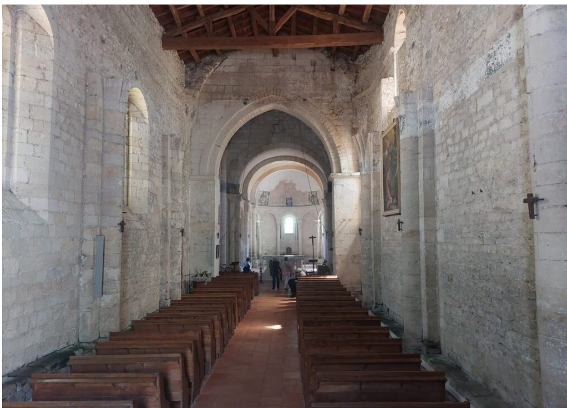
L'église de Mornac sur Seudre.