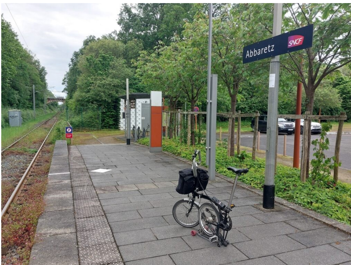
En gare d'Abbaretz à 12h00.