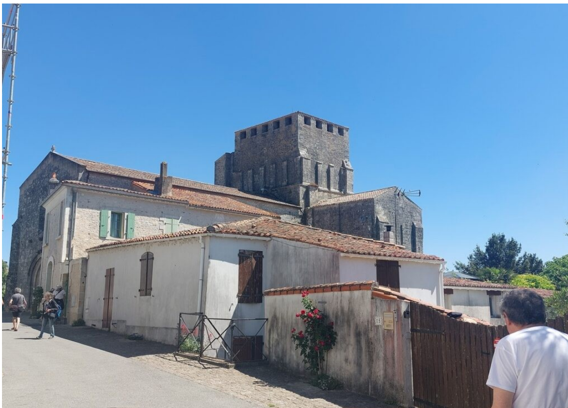
L'église de Mornac sur Seudre.