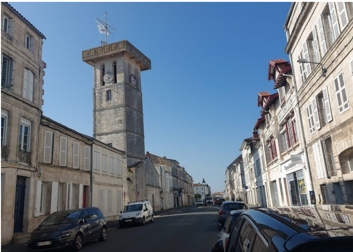
La Tour des Signaux à Rochefort.