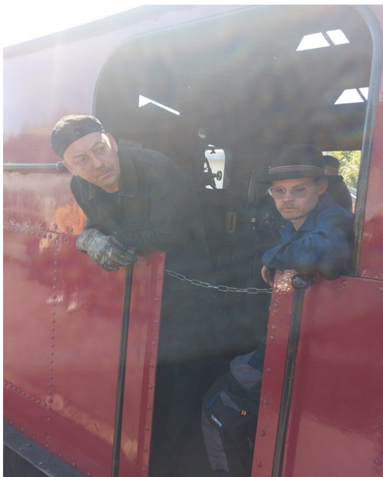
Les chauffeurs chargés de l'alimentation de la chaudière en charbon.