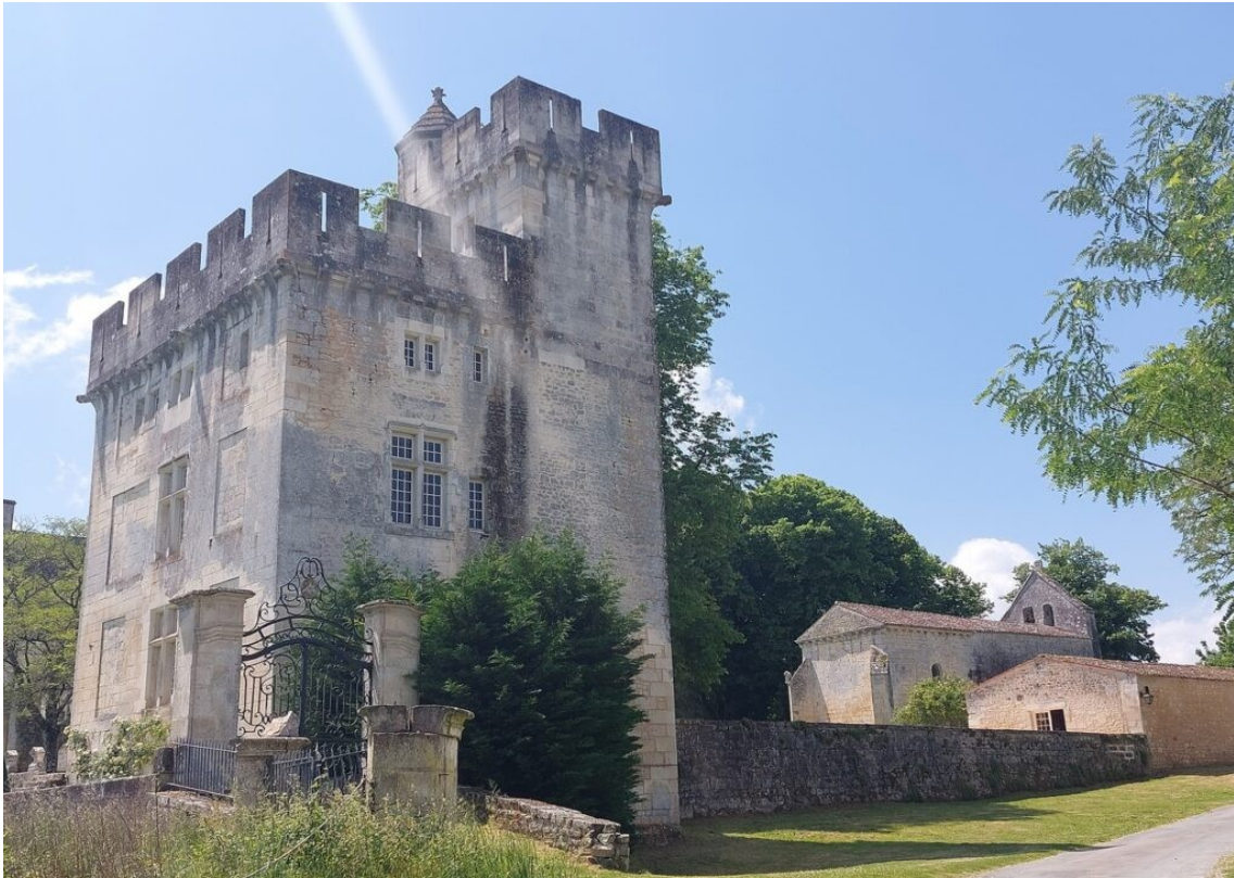
Le donjon médiéval et la chapelle du château de Crazannes.