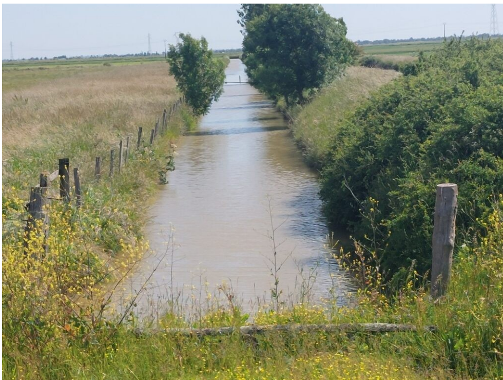
Rigole d'alimentation du canal anti-char à Esnandes. Construit en 1942 sur décision de l'occupant allemand pour empêcher un débarquement allié, le canal anti-char a été creusé par l'organisation TODT (groupe de génie civil et militaire du Troisième Reich) qui a nécessité à l'époque la réquisition de matériels (grues notamment) mais aussi de nombreux bras. Long de 5 kilomètres, sur une largeur d'environ 20 mètres, le canal anti-char a complété un dispositif qui comprenait également la construction de nombreux blockhaus. Il a servi de frontière nord à la Poche de La Rochelle durant l'hiver 1944-1945.