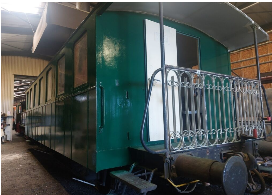
Voiture voyageur en cours de rénovation.