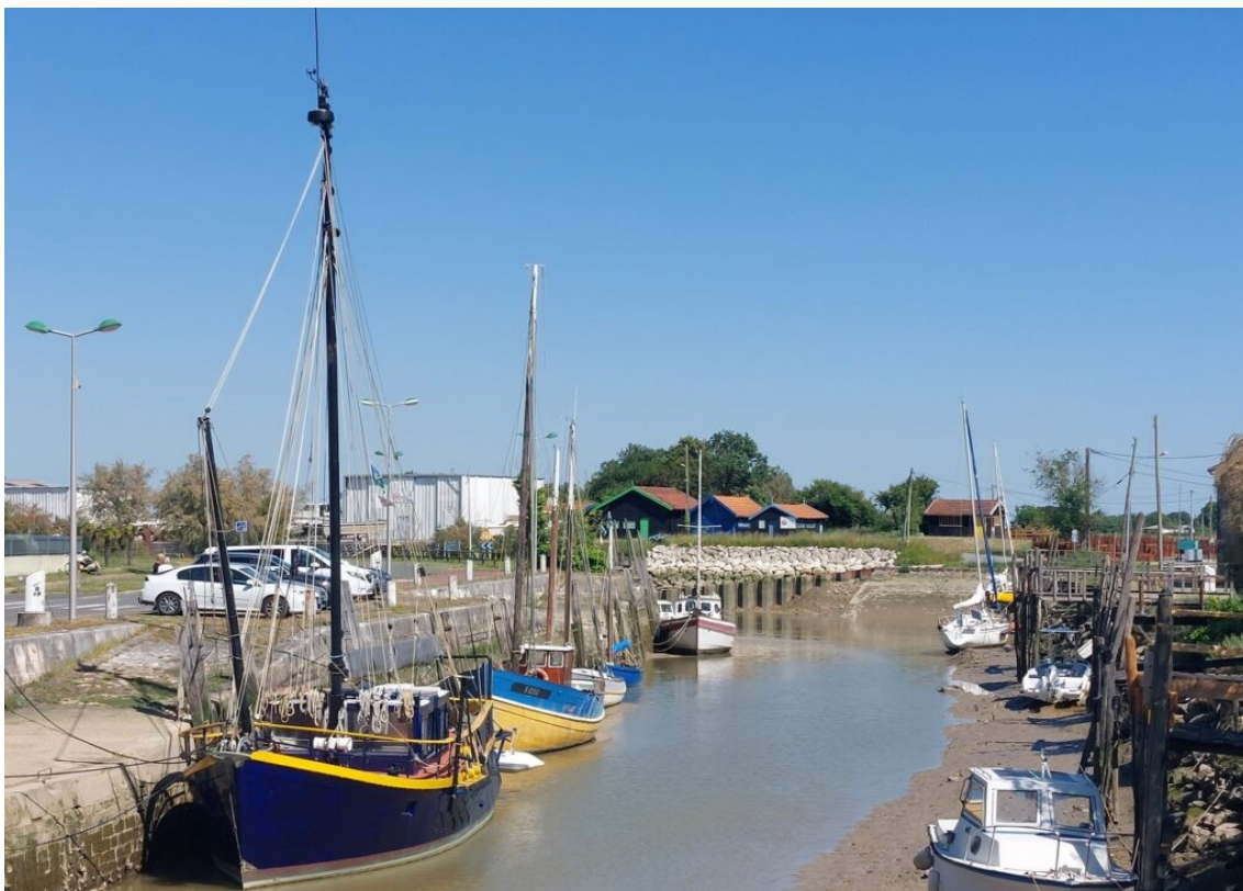
Le chenal d'accès au port de la Tremblade.