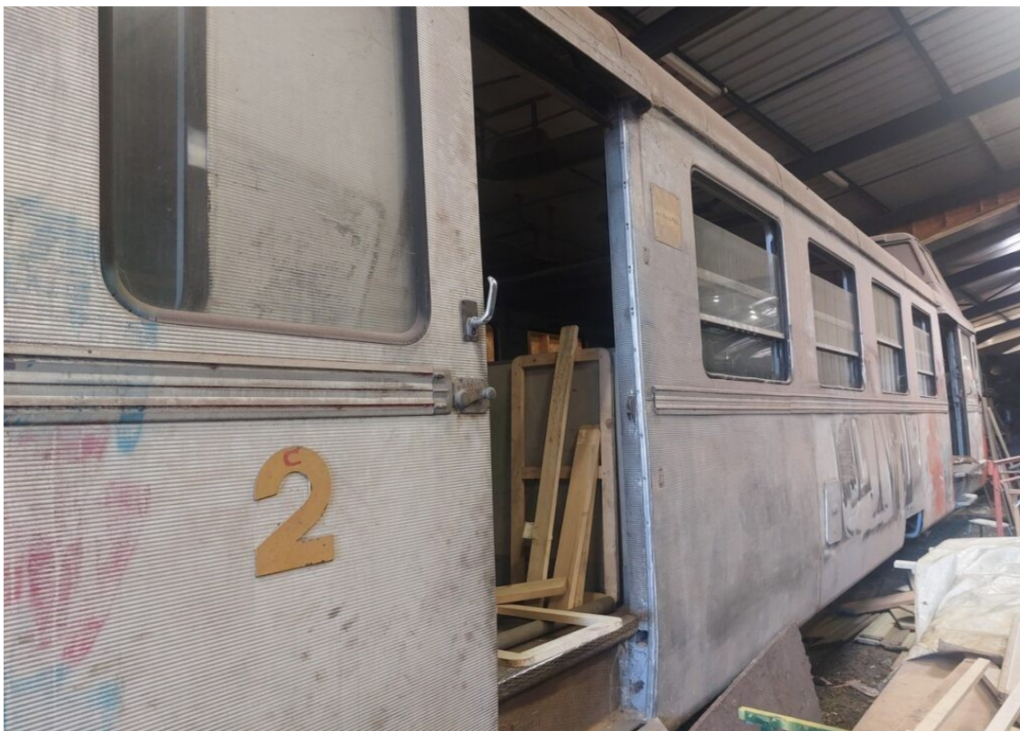
Vieil autorail en attente de restauration.