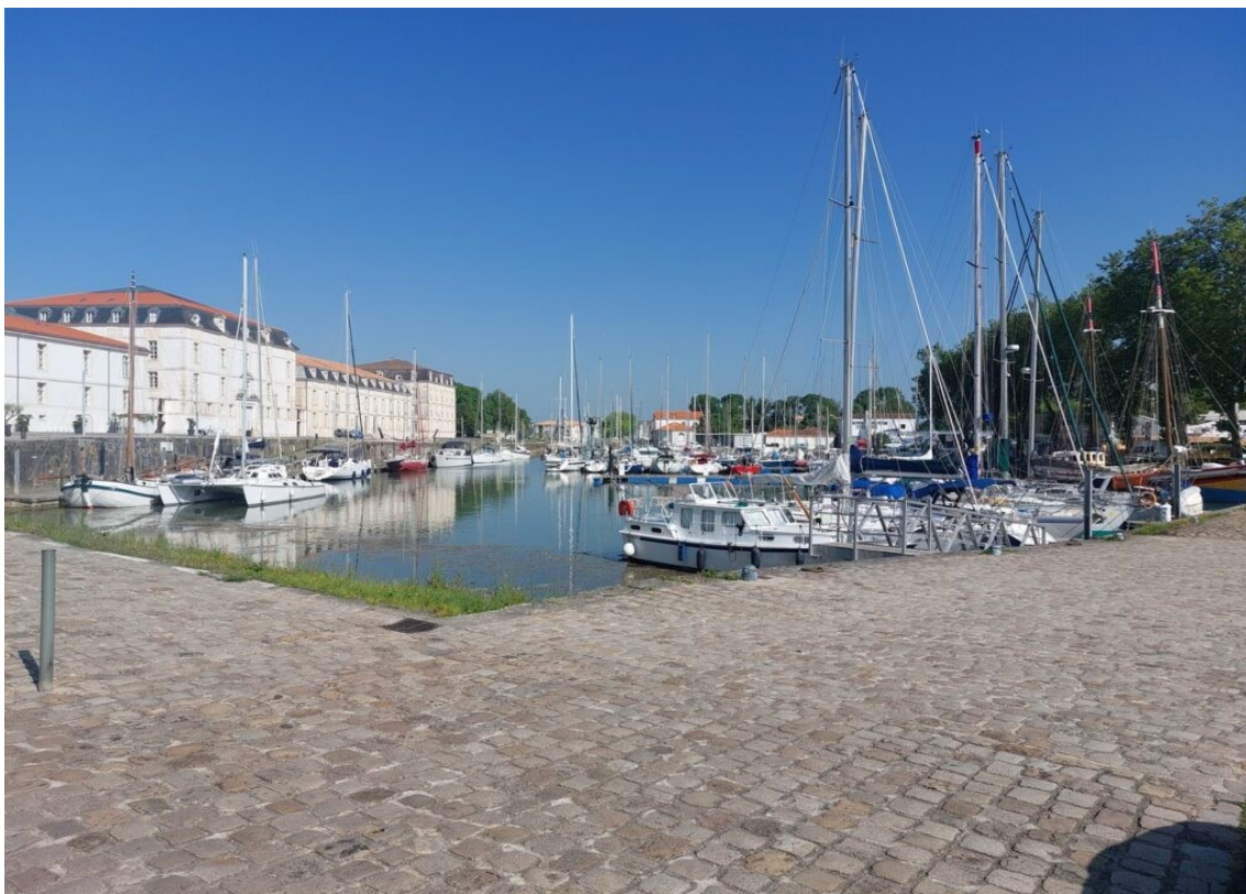
Le Quai aux Vivres et le port de plaisance.