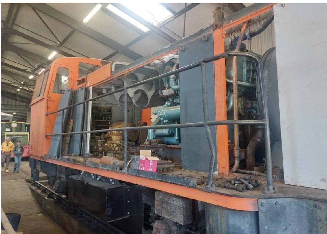
Locomotive diesel en cours de restauration.