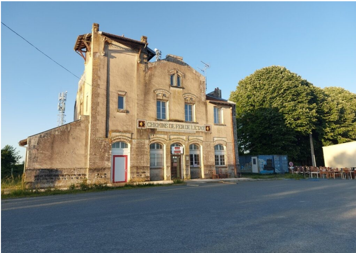
L'ancienne gare de Saint Romain de Benet.