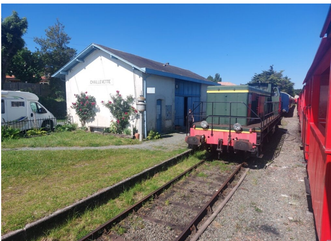
La gare de Chaillevette où sont situés les ateliers de l'association Trains et Traction, association, créée en 2007, de sauvegarde des savoir-faire, des atmosphères et des patrimoines ferroviaires, en s'appuyant sur la reprise de l'exploitation du Train des Mouettes. Aujourd'hui ce sont plus de 120 bénévoles.