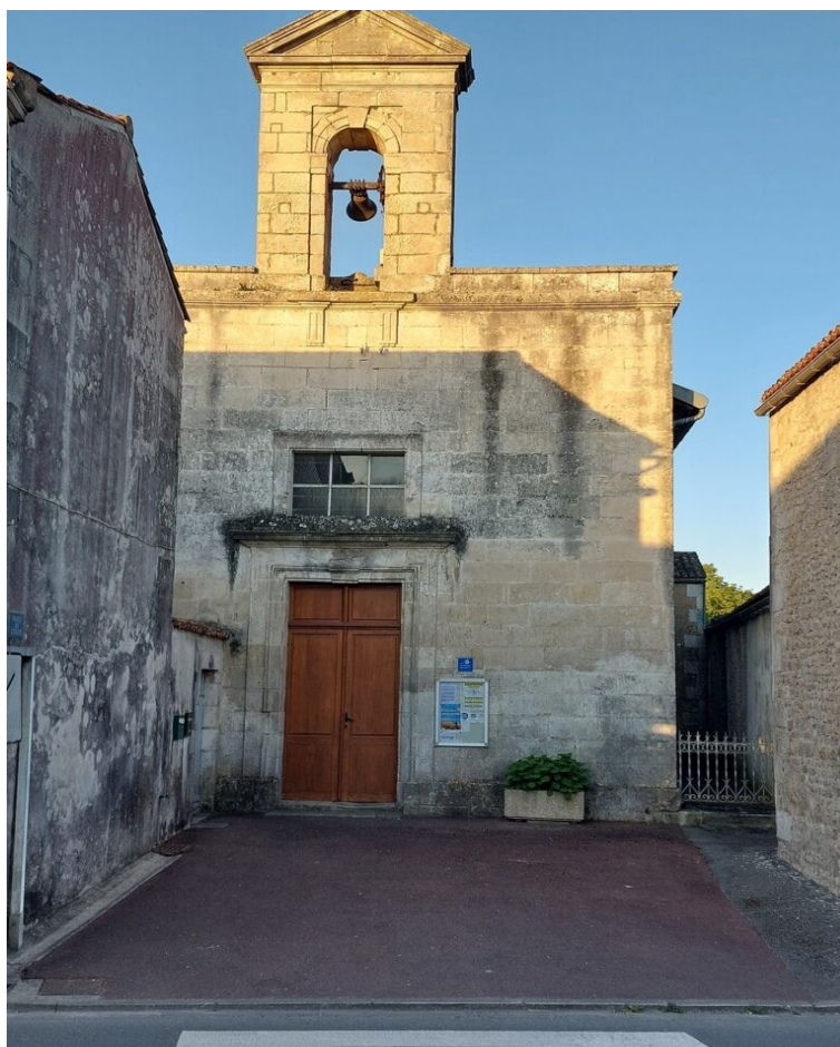
7h00 à Pisany, la cloche sonne à toute volée.