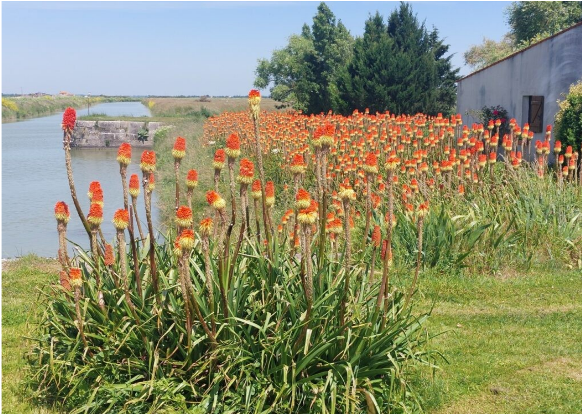
Tison de Satan, jolie fleur vivace.