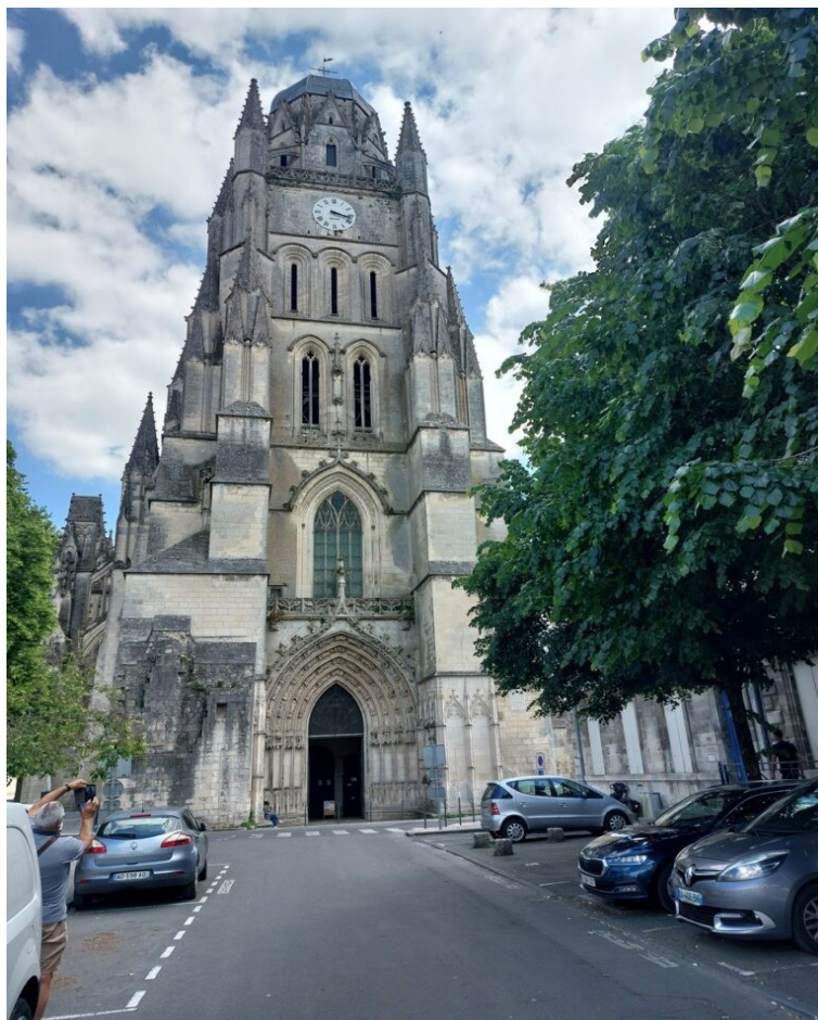
La cathédrale de Saintes.