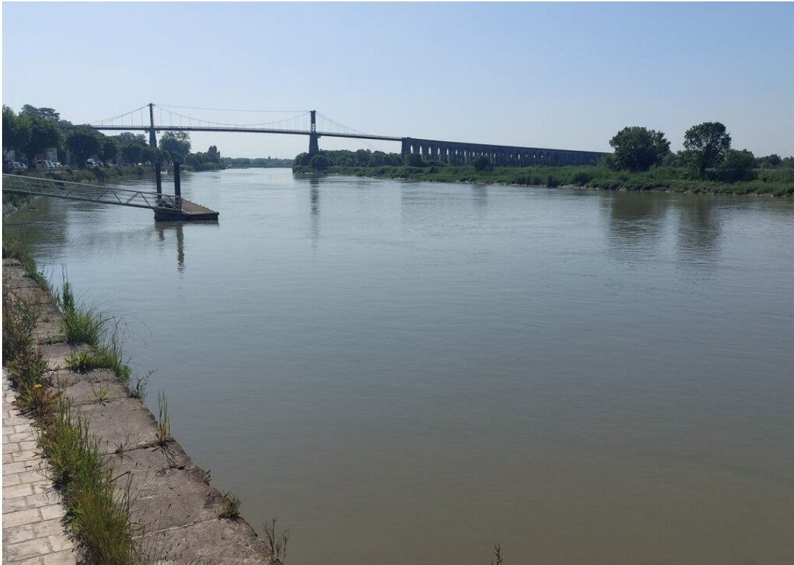
Le pont suspendu de Tonnay-Charente.