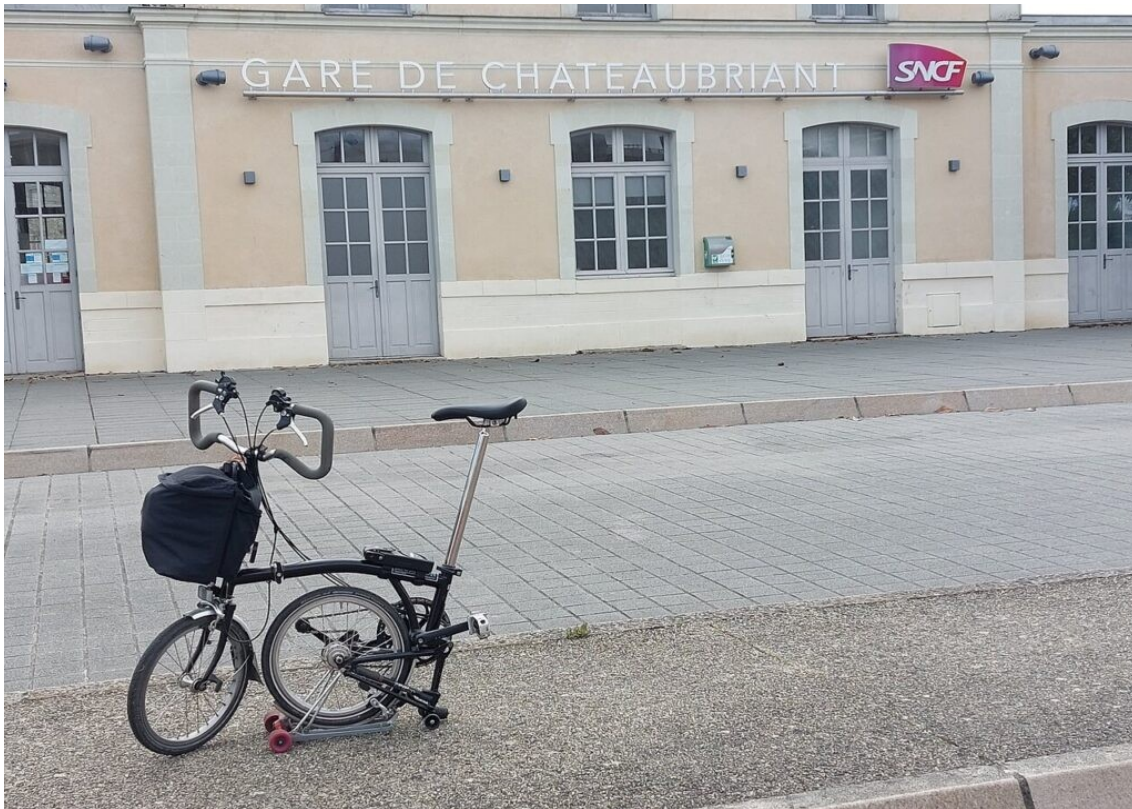
En gare de Châteaubriant à 10h35.