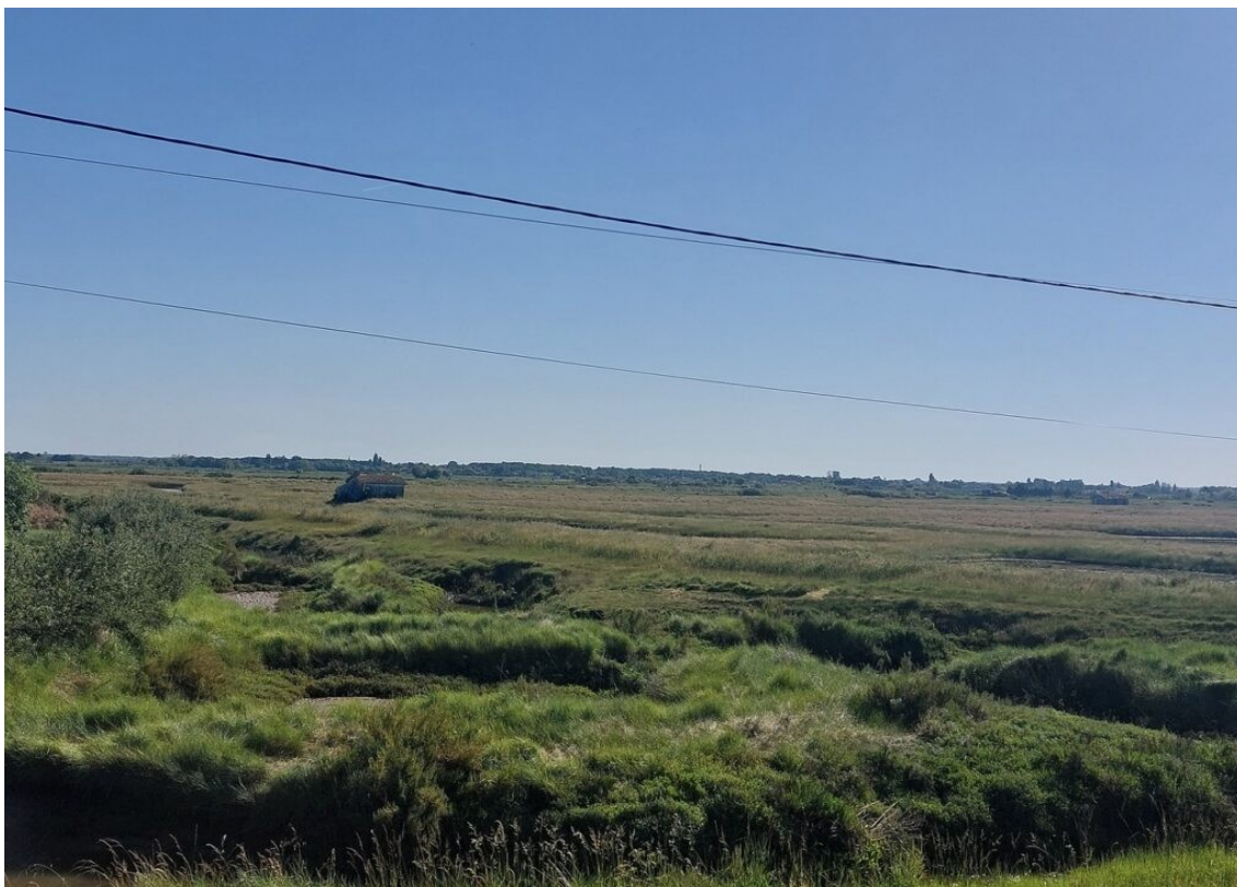
Le marais de la Seudre.