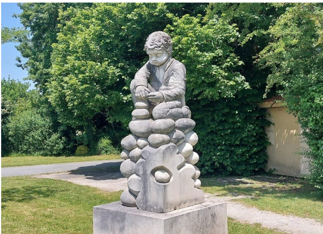
Sculpture à Crazannes, lieu réputé pour ses anciennes carrières, avec des parcours de sculpture.