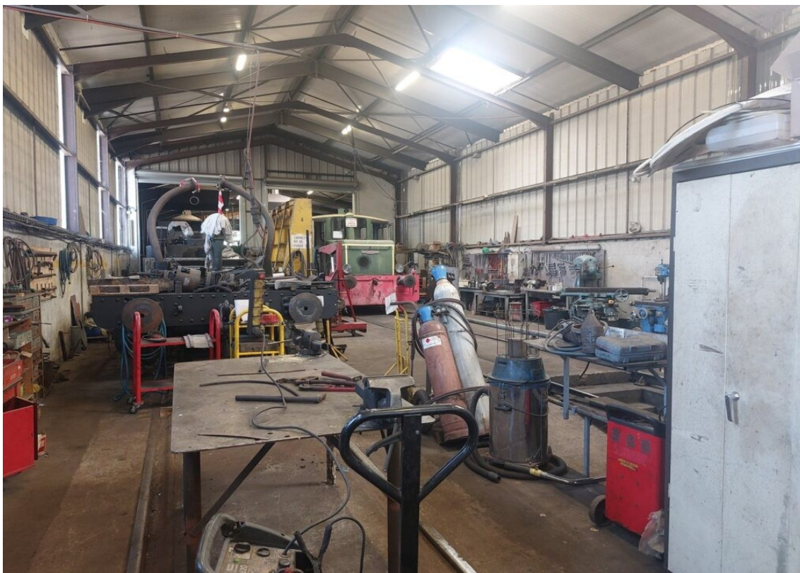
Les ateliers de Tains et Traction à Chaillevette.