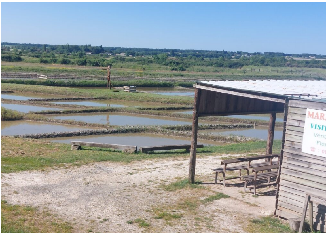
Les marais salants de Mornac sur Seudre.